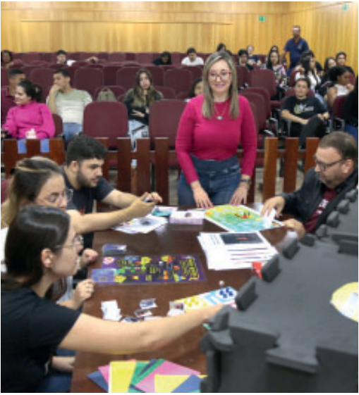
Projeto concluiu as suas atividades