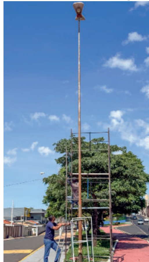
Ações são realizadas em toda a cidade