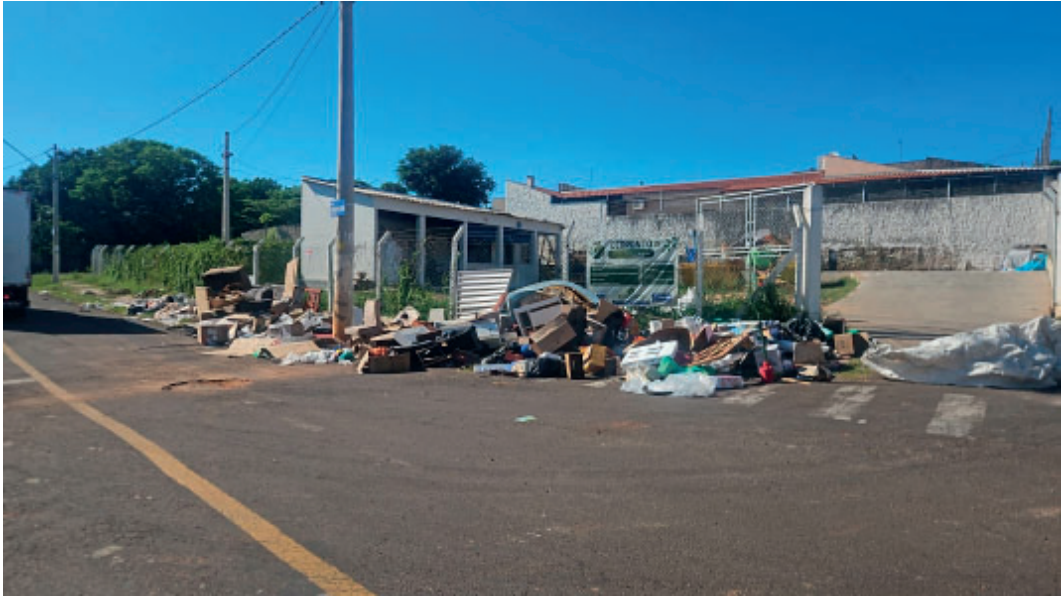
Prefeitura registrou descarte irregular de resíduos em todos os ecopontos

No Ecoponto Sul, localizado na rua Joaquim Dias, ao lado do Complexo de Trânsito, o funcionamento é de segunda a sexta-feira, das 8h às 17h, e aos sábados, das 8h às 12h. No Ecoponto Oeste, na rua Alcides Caliman, 704, Jardim Ca-