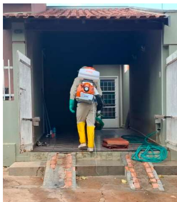
Ações reforçam combate ao mosquito

Durante a passagem da equipe, a população deve colaborar mantendo portas e janelas abertas, protegendo alimentos e utensílios