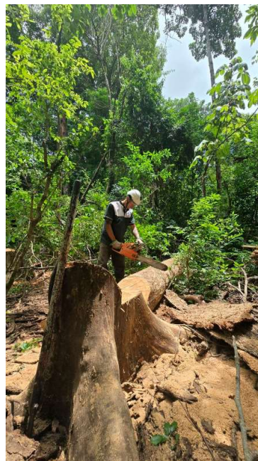
Ação incluiu corte de árvores sob risco