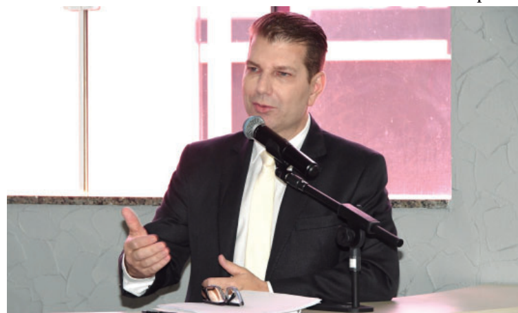
Itapuã reforçou que a segurança alimentar é uma prioridade permanente de seu governo