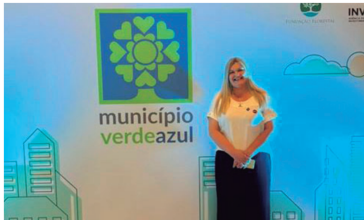
Posição é a melhor obtida pelo município desde o início de sua participação no programa

Paralelamente à cerimônia do Município Verde Azul, o Governo