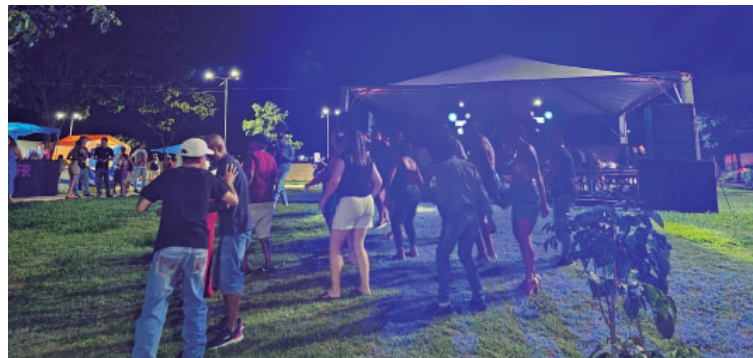
Iniciativa consolidou-se como um dos projetos culturais mais queridos da população

levante no calendário do município. A realização do evento evidencia a capacidade administrativa da Prefeitura em captar recursos, executar políticas públicas e utilizar a cultura como instrumento de desenvolvimento humano e social.