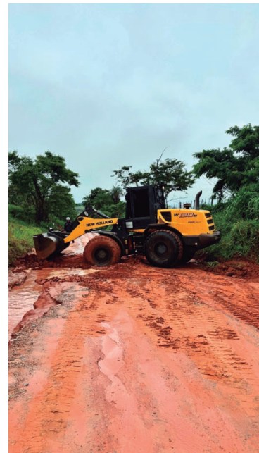
Trabalho avançou pelo fim de semana