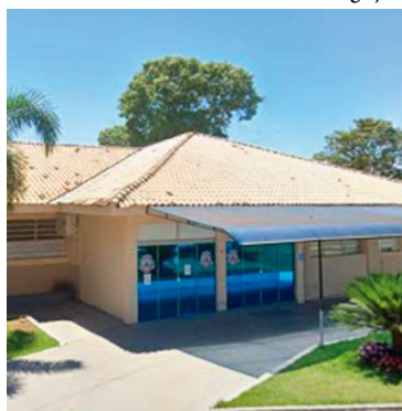
PSF 3 terá horário estendido no dia 8