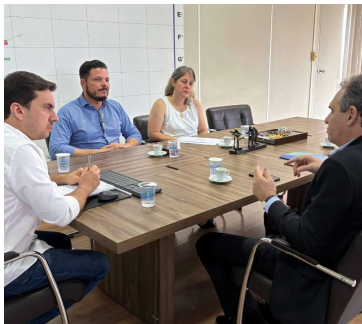
Verba federal não exige contrapartida