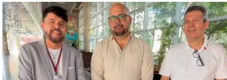
Anúncio foi realizado pelo prefeito Rodrigo Silva, em vídeo publicado nas redes sociais