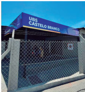
Reforma da unidade foi inaugurada

vestimentos novos, pintura completa, internet modernizada e reforço estrutural com 125 estacas, além de outras adequações.