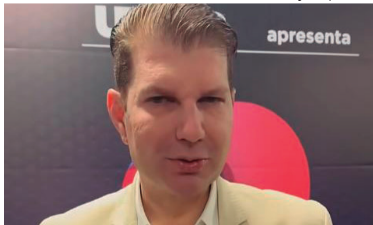
Prefeito Fernando Itapuã compartilhou a boa notícia por meio de suas redes sociais

deceu o trabalho dos servidores municipais, enfatizando que o reconhecimento é coletivo. “Principalmente aqueles que trabalham na coleta do