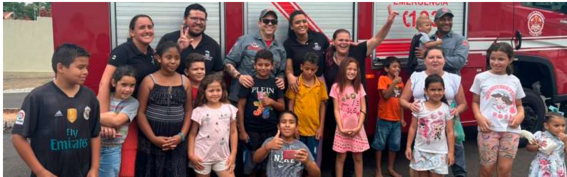
O evento contou com a participação especial do Corpo de Bombeiros, que animou as crianças com atividades lúdicas e interativas

O evento contou com a participação do Corpo de Bombeiros, que interagiu com as crianças por meio de atividades lúdicas e recreativas, contribuindo para tornar a celebração ainda mais especial. Ao longo da confraternização, foram distribuídos brinquedos e oferecidos alimentos como