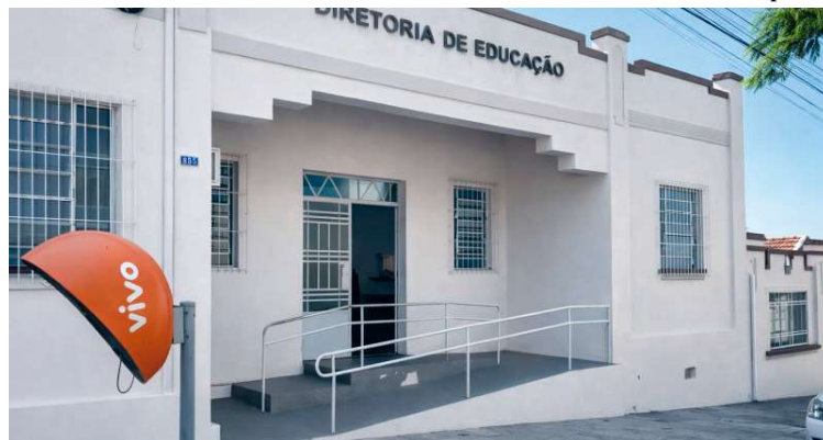
Inscrições devem ser realizadas na Diretoria Municipal de Educação de Vera Cruz

Todos os cargos têm jornada de oito horas diárias. O salário base é de R$ 1.518,67 para ajudante geral e servente, e de R$ 1.959,36 para operador de máquinas. Para concorrer, é exigido ensino fundamental completo. No caso de operador