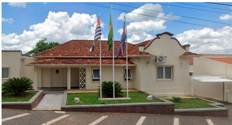
Decreto publicado no Diário Oficial organiza o funcionamento de serviços