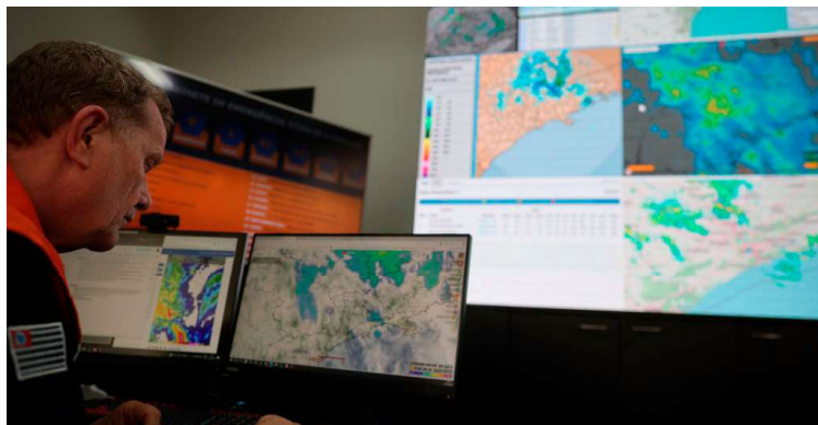
Região de Marília deve registrar acumulados médios de chuva ao longo do dia

De acordo com o CGE (Centro de Gerenciamento de Emergências), a instabilidade é provocada pela atuação de um sistema de baixa pressão na costa paulista, que mantém o tempo fechado e favorece precipitações contínuas. As chuvas podem variar de moderadas a fortes, com possibilidade de rajadas de vento, descargas elétricas e volumes elevados no