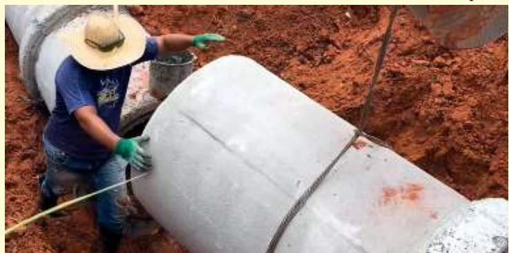
Serviços incluem substituição de tubulação e instalação de novas galerias