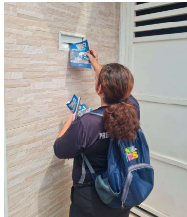
Saúde realizou 20 mil visitas domiciliares