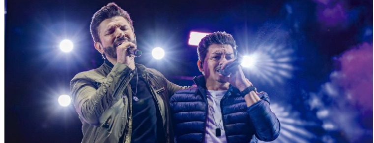
Prefeitura publicou contratação da dupla sertaneja consolidada no cenário nacional

A Prefeitura ressalta que a contratação atende ao interesse público, ao garantir uma