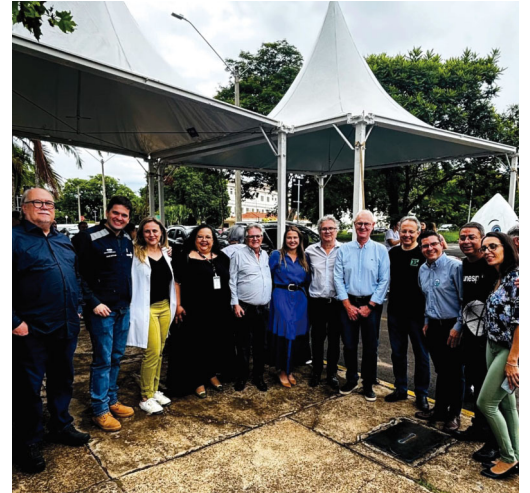
Secretária representou Marília no evento

lia, com 250 residências em oito quadras; e na USF Lácio (condomínio Esmeralda Residence), onde foram vistoriadas 110 casas.