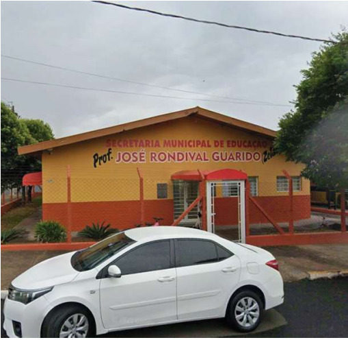
Município garantiu uniformes para 2026

tura promove, no próximo sábado (31), das 14h às 18h, uma ação com brinquedos, cachorro-quente e refrigerante, na Rodoviária Municipal. Todas as atividades são gratuitas.