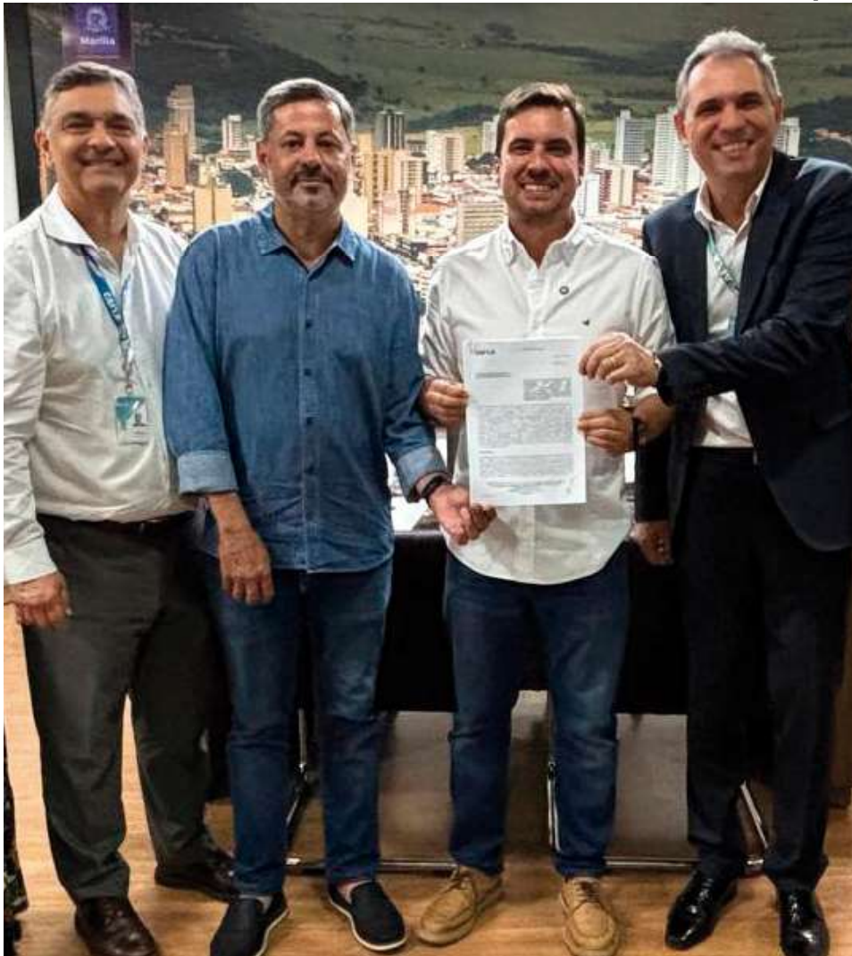
Prefeitura de Marília assinou convênio para a execução de obras de recapeamento em diversas ruas e avenidas