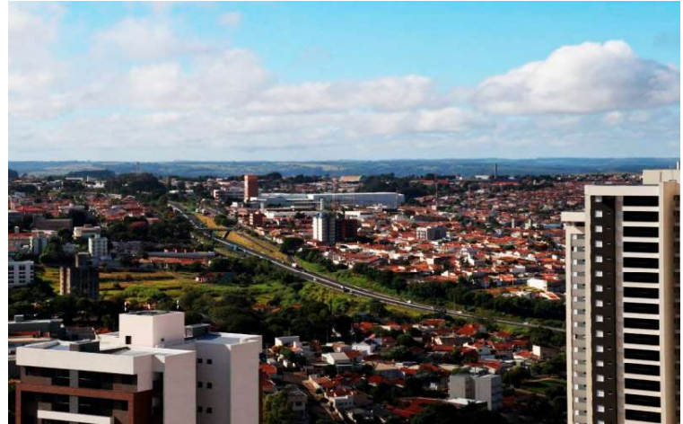
Somente no mês de novembro, município apresentou saldo positivo de 107 vagas