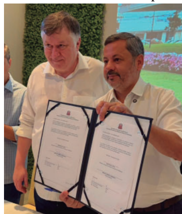
Vice-prefeito recebeu o secretário estadual