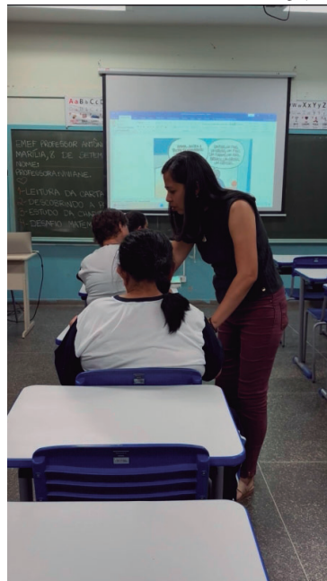
Aulas começam no dia 5 de fevereiro