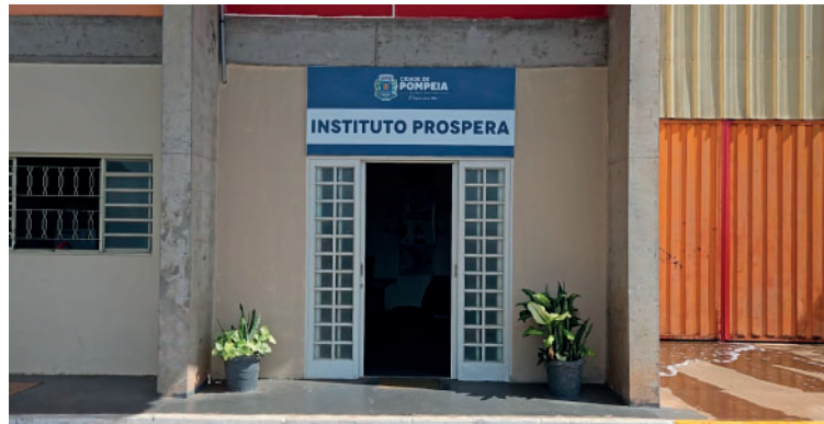
Interessados podem se inscrever na sede do Instituto Prospera ou de forma online

As aulas têm início previsto para o mês de fevereiro, de acordo com a formação das turmas, e serão realizadas