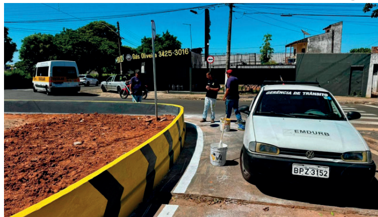
Novo dispositivo promete trazer mais segurança e fluidez ao trânsito na região

Antes da execução da obra, a engenharia de trânsito realizou um estudo técnico, que incluiu a simulação da implantação de semáforos. A alternativa, no entan-