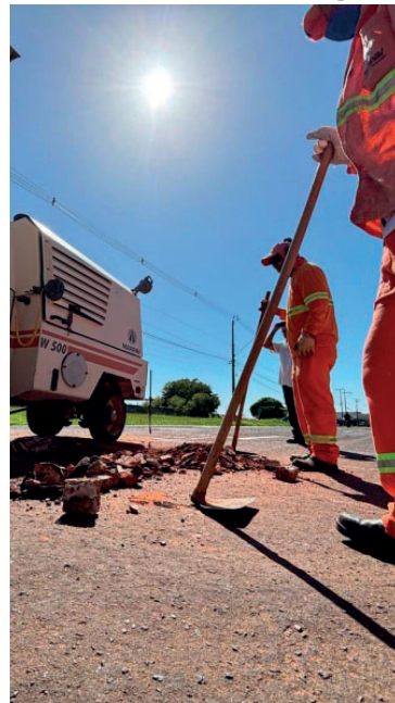
Serviços seguem cronograma definido