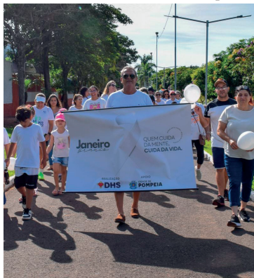
Registro da caminhada do ano passado

e retorno ao mesmo ponto, permitindo a participação de pessoas de diferentes idades.