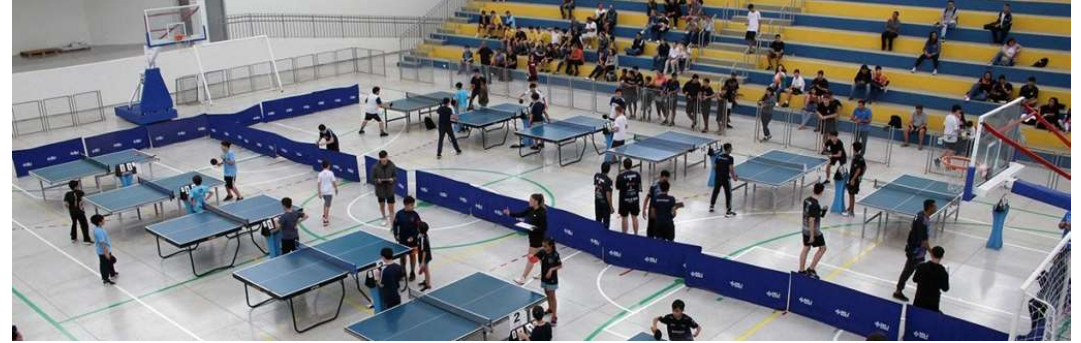
Assessoria de Imprensa

tonieta, a programação inclui aulas de alongamento, futebol e ginástica funcional, em horários distribuídos entre os períodos da manhã e da tarde. Já no Ginásio Neusa Galetti, serão ofertadas atividades como alongamento, badminton, capoeira, dança, futsal, futsal feminino, ginástica funcional, handebol, jiu-jitsu, karatê, tênis de mesa e voleibol.