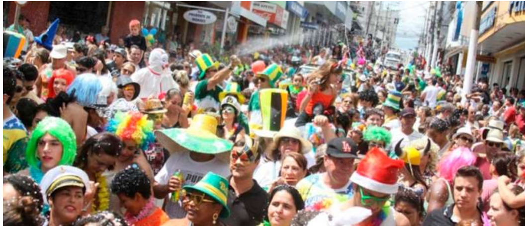
Bloco é aberto à participação do público e deve reunir centenas de foliões no Centro

A concentração está prevista para ocorrer na rua 9 de Julho, nas proximidades do Camelódromo. De lá, o desfile seguirá pelas principais vias do centro comercial, passando pela rua São Luiz e pela rua José de Anchieta, com encerramento na avenida Sampaio Vidal, em frente