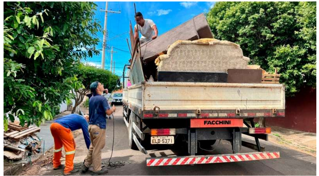
A ação é coordenada pela Secretaria Municipal do Meio Ambiente e Serviços Públicos