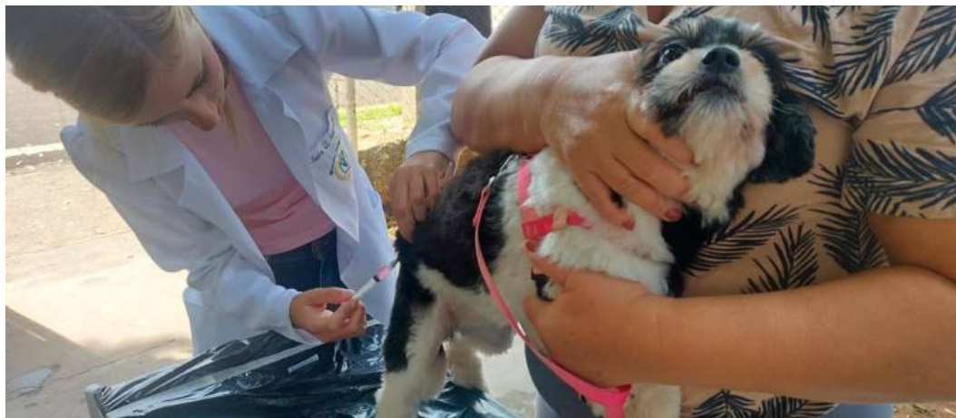
Ao todo, serão disponibilizadas 400 doses para cães e gatos na USF Altaneira

Poderão ser vacinados cães e gatos com idade superior a