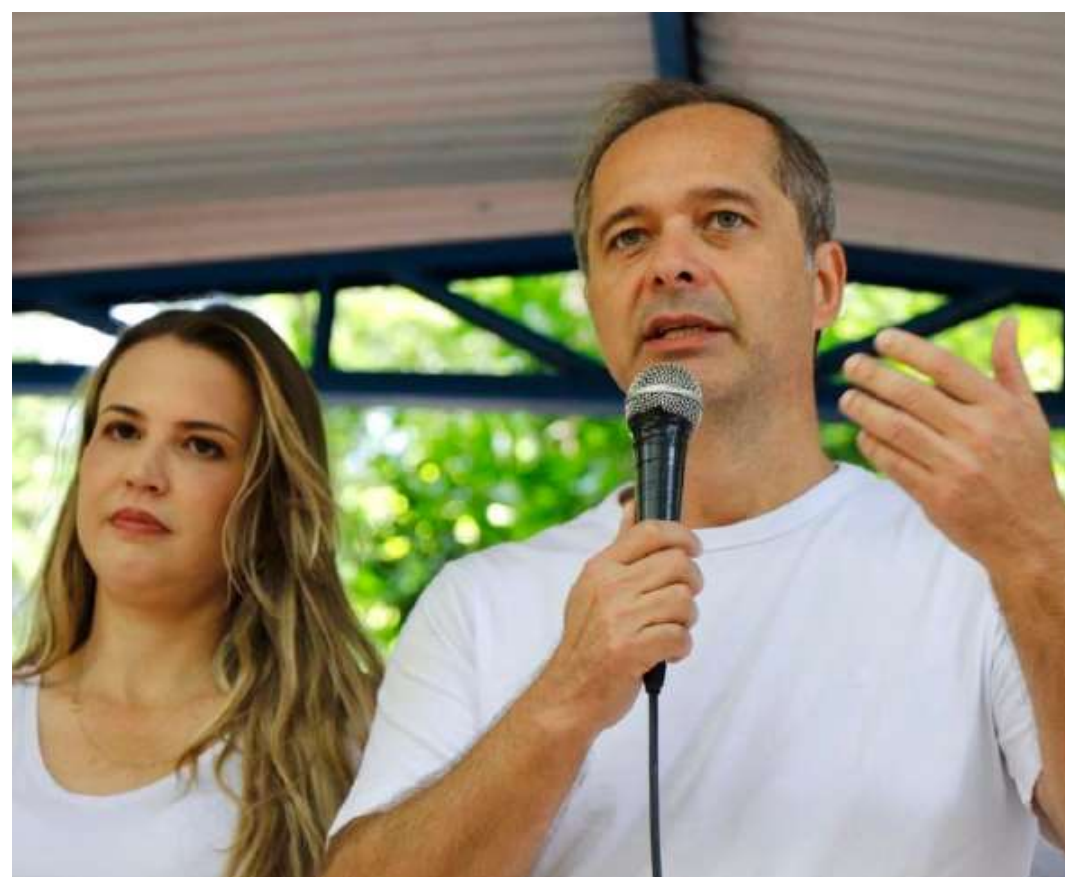
Presidente da Câmara reforçou a importância da colaboração da população