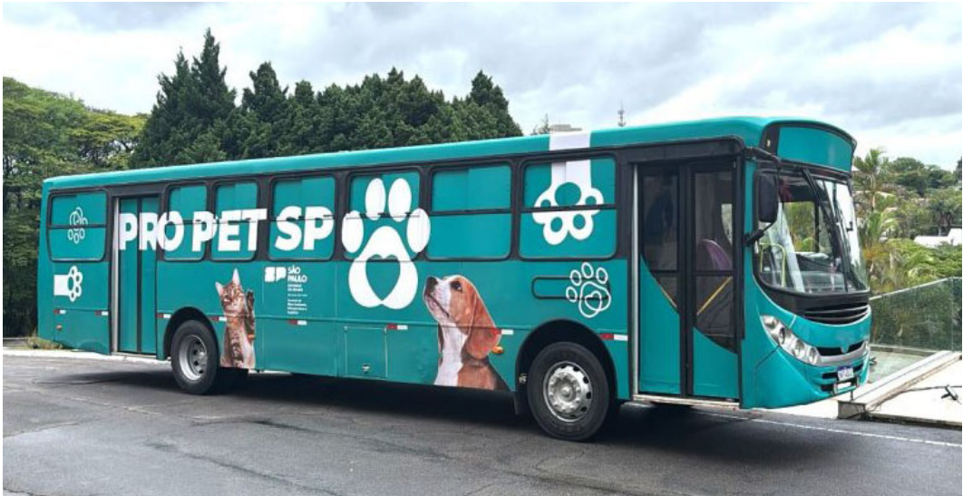
Veículo do Programa Pro Pet SP, iniciativa do Governo do Estado de São Paulo

O programa prioriza ações que promovem a saúde e a qualidade de vida dos pets, além de estimular a responsabilidade na guarda de animais e aproximar serviços públicos da comunidade.