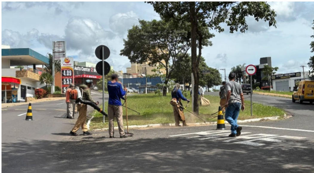
Entre os serviços executados estão capinação, poda, roçagem e limpeza geral

As ações estão concentradas, neste momento, nas avenidas Via Expressa Sampaio Vidal, João Ramalho e Alexandre Chaia, localizadas na zona Sul da cidade, além da avenida Sanches Cibantos, na zona Norte. As equipes também atuam na rua XV de Novembro, um dos principais corredores de tráfego da re-