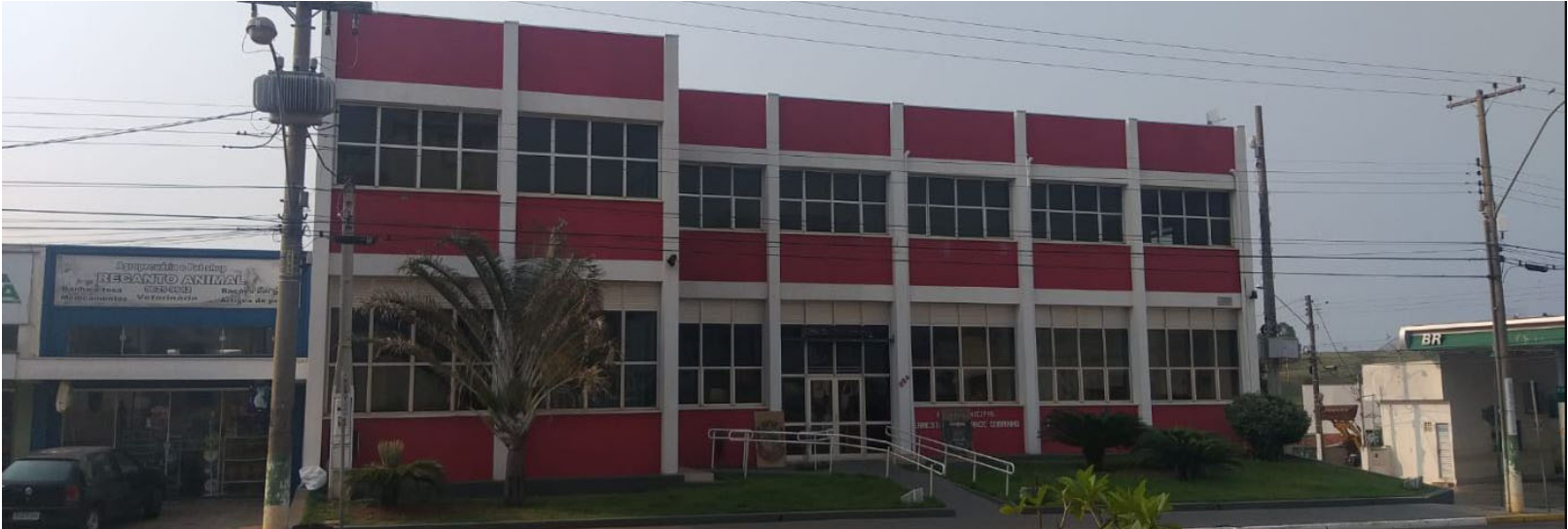
Vista da Prefeitura Municipal de Ocauçu; novos decretos publicados estabelecem regras para a gestão dos servidores municipais

O Decreto nº 3.647/2026 disciplina a realização de horas extras. As atividades extraordinárias só poderão ocorrer em situações excepcionais, como emergências ou calamidades, e devem ser previamente justificadas pelos gestores. O limite má-