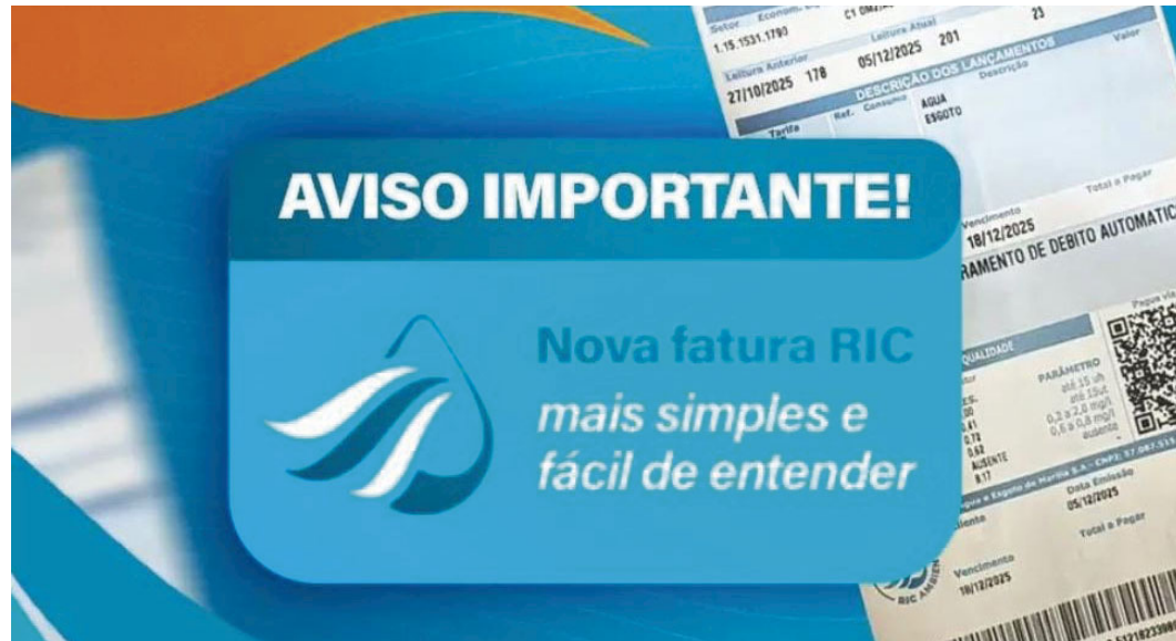
Concessionária divulgou as mudanças aplicadas na fatura de água em Marília

De acordo com a empresa, a nova fatura foi redesenhada para apresentar, de forma mais intuitiva e simplificada, as principais informações do imóvel atendido, como o número do hidrômetro e o QR Code, recurso já utilizado anteriormente e que facilita o acesso rápido aos serviços. A proposta,