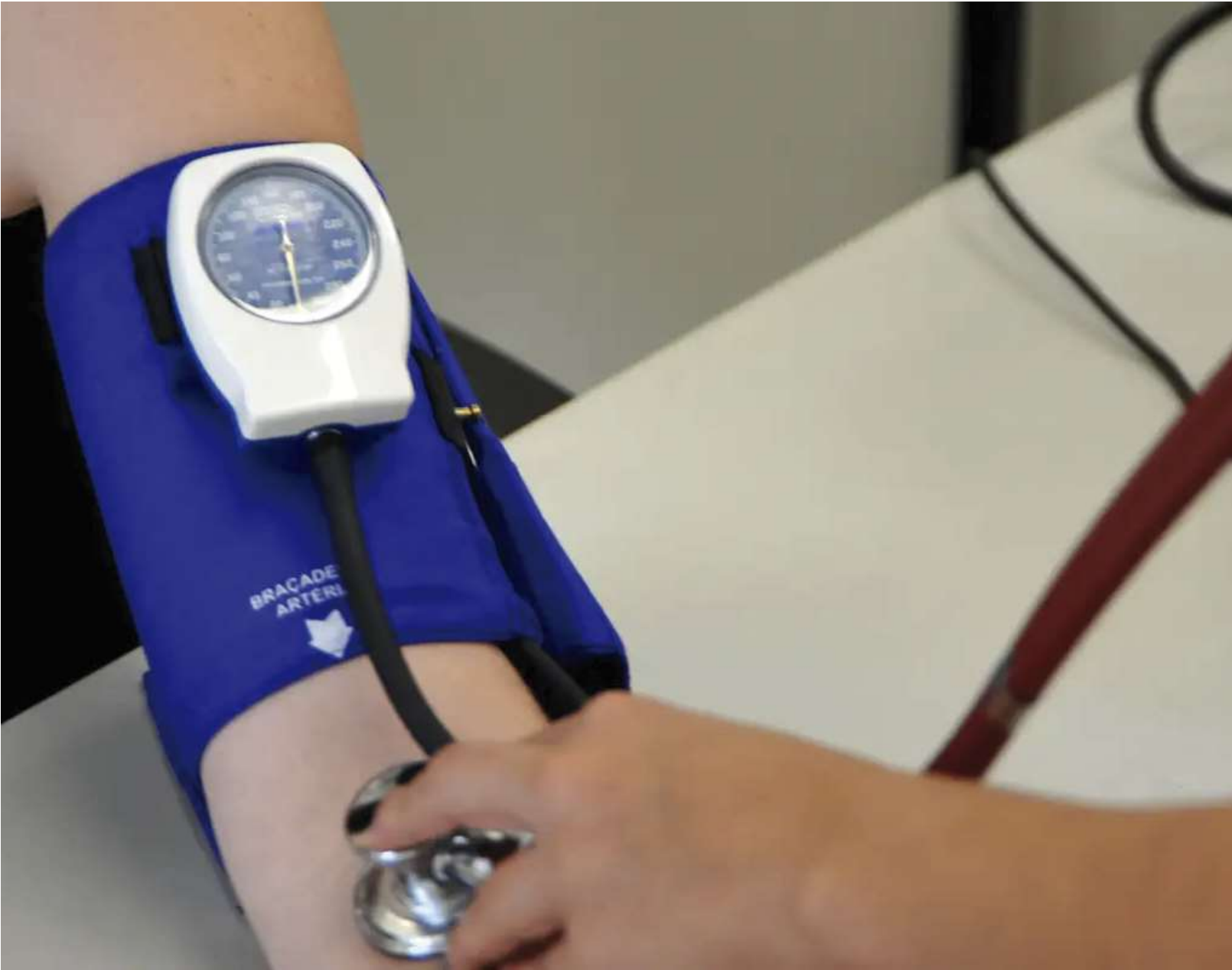
Materiais são utilizados em ações preventivas, diagnósticos, tratamentos e procedimentos curativos nas unidades de saúde