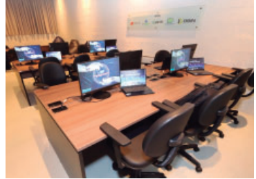
Anúncios celebram 70 anos da Unimar

As aulas têm início previsto para fevereiro. As matrículas já estão abertas e contam com descontos de lançamento que variam entre 50% e 60%, conforme o curso, válidos por tempo limitado. As graduações serão ofertadas na sede da Unimar, em Marília, e em polos selecionados. Mais informações em ead.unimar.br .