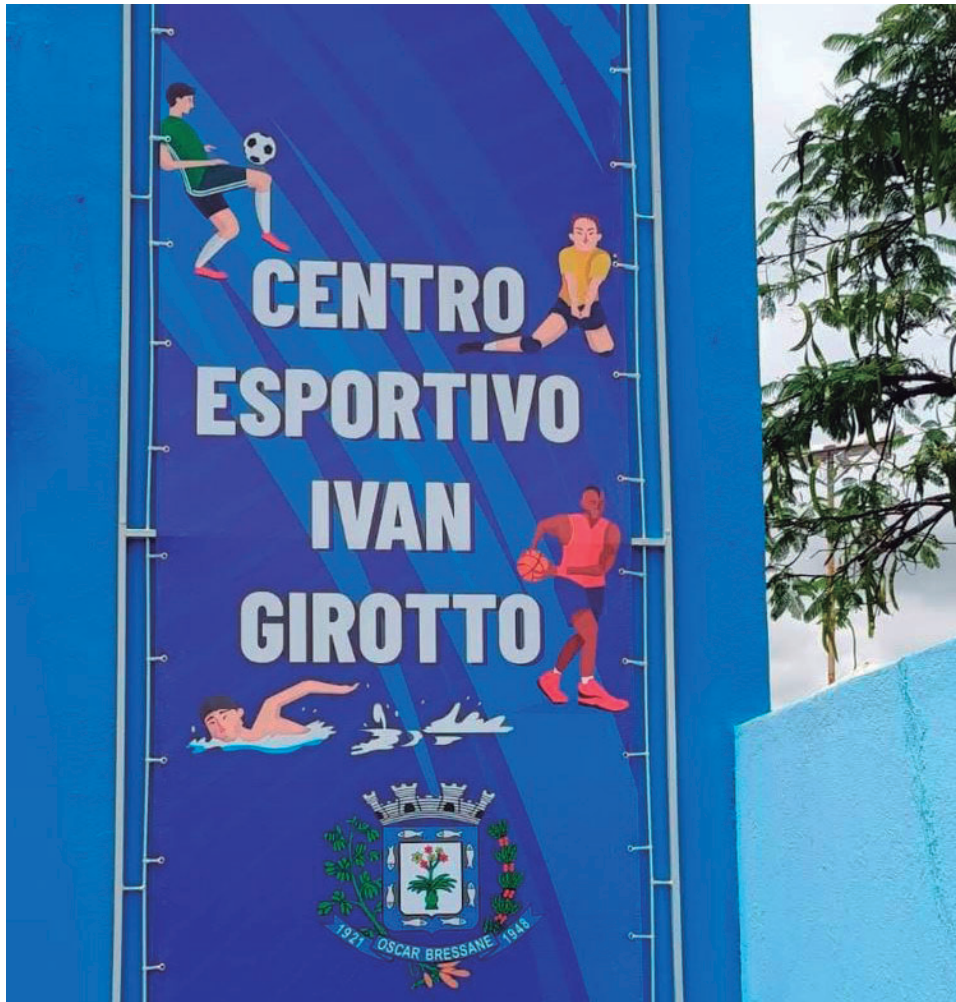
Melhorias têm como objetivo ampliar as condições de uso do espaço por atletas, equipes técnicas e pela comunidade