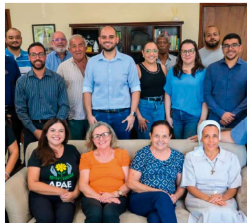
Reunião ocorreu no gabinete do prefeito

Para este ano, com a retomada desses fundos e diante do cenário econômico nacional, o repasse do Tesouro Municipal está estimado em aproximadamente R$ 500 mil. Segundo a administração municipal, os repasses mensais às instituições serão mantidos.