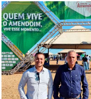
Representantes de Pompeia no evento

res rurais, empresas do setor e especialistas, promovendo um importante espaço para troca de conhecimentos, inovação tecnológica, capacitação técnica e demonstrações práticas voltadas à cultura do amendoim. Ao longo