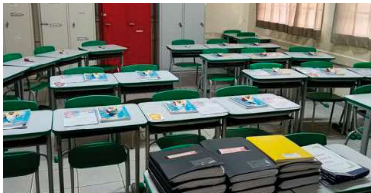
Oriente inicia ano letivo de 2026 com recepção de alunos na próxima segunda