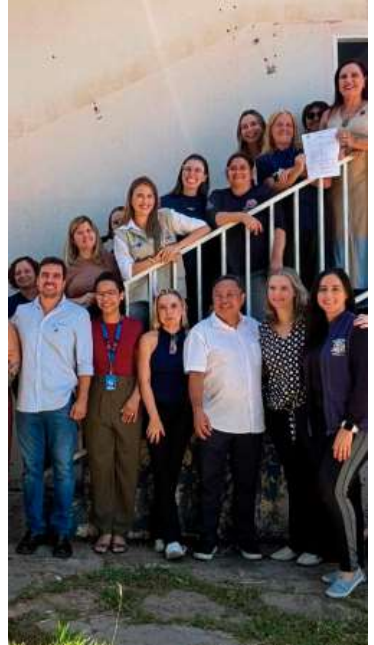
Evento de autorização reuniu autoridades