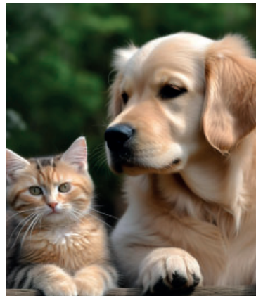
Castramóvel oferece vagas em Pompeia

afirmou que iniciativas como essa reforçam o compromisso do município com políticas públicas voltadas à qualidade de vida, à responsabilidade social e ao respeito aos animais.