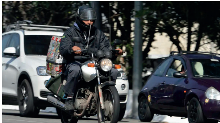
Nova regra foi instituída por meio de lei sancionada em 24 de dezembro

“O projeto foi planejado com responsabilidade para aliviar o orçamento de quem mais precisa, sem comprometer o