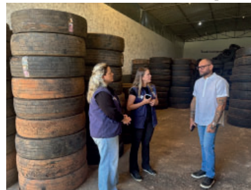
Destinação correta de pneus é reforçada