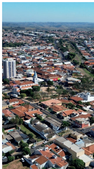
Dados oficiais apontam números inéditos

mada parceria com a Unesp de Assis para reestruturação da rede e qualificação do atendimento psicossocial.