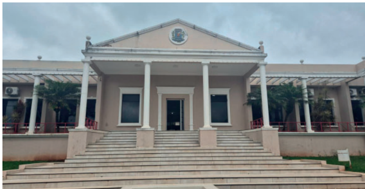
Prefeitura deixa de realizar o recebimento presencial de pagamentos nos guichês

A mudança é conduzida pela Secretaria Municipal de Finanças e Planejamento e faz parte de um conjunto de adequações às normas e rotinas bancárias e federais. Segundo a administração, a nova sistemática também atende a critérios de segurança, controle