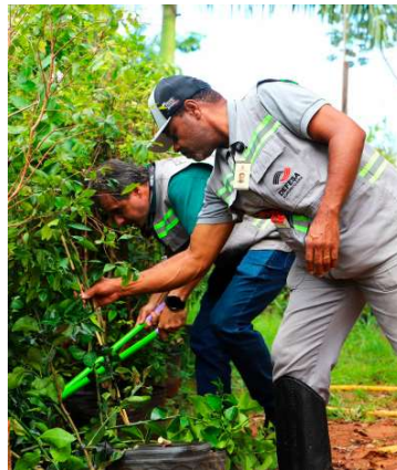
Município recebe ações regularmente

em todo o Estado, com a retirada de mais de 60 mil mudas de circulação. Além das ações de fiscalização, o trabalho inclui iniciativas educativas e a manutenção de canais de denúncia para iden-