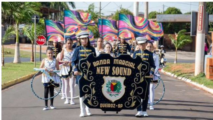
Matrículas para a Banda Marcial New Sound são destinadas a crianças e adolescentes

Entre as opções disponíveis está o Projeto de Violão, que conta com vagas para turmas infantis e adultas, possibilitando o acesso ao ensino musical tanto para iniciantes quanto para alunos que desejam dar continuidade às aulas.