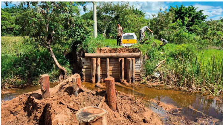
Secretaria intensifica manutenção em ponte sobre o córrego do Macuco, em Rosália

Segundo a Secretaria de Infraestrutura, a manutenção da estrutura encontra-se em fase avançada. As obras das alas laterais já foram concluídas em ambos os lados da ponte. Atualmente, as equipes finalizam