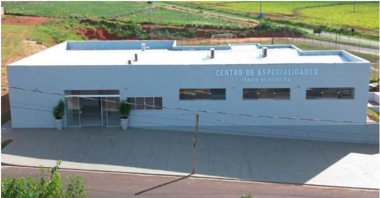
Ampliação prevê a implantação de novas salas no Centro de Especialidades

A obra deve ser concluída em seis meses. No primeiro mês,