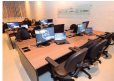
Anúncios celebram 70 anos da Unimar

As aulas têm início previsto para fevereiro. As matrículas já estão abertas e contam com descontos de lançamento que variam entre 50% e 60%, conforme o curso, válidos por tempo limitado. As graduações serão ofertadas na sede da Unimar, em Marília, e em polos selecionados. Mais informações em ead.unimar.br.