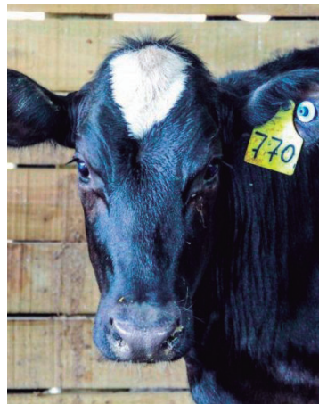
SP utiliza modelo de bottons auriculares

marcação a fogo, o sistema utiliza bottons auriculares, que proporcionam maior bem-estar aos animais, aumentam a produtividade e melhoram o manejo, além de