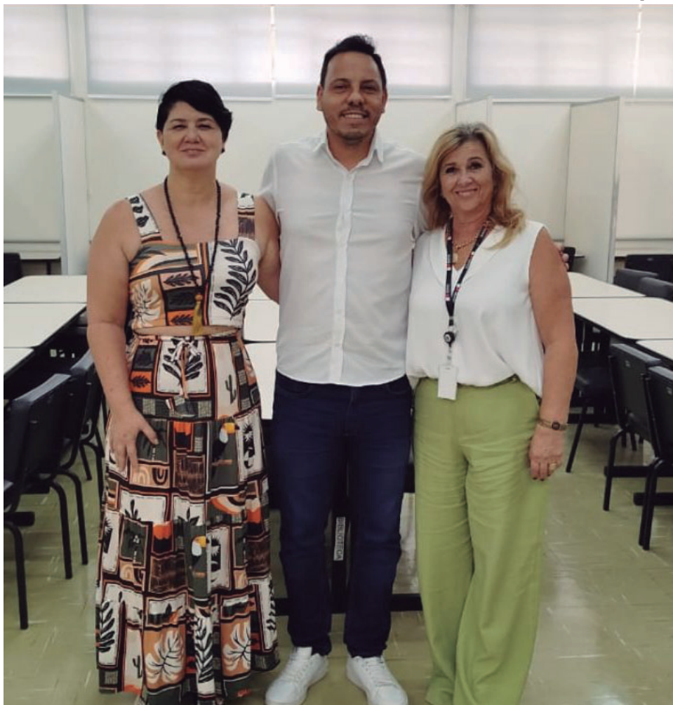
Município participou de reunião realizada na Diretoria Regional de Assistência Social com foco no Plano de 2026 a 2029