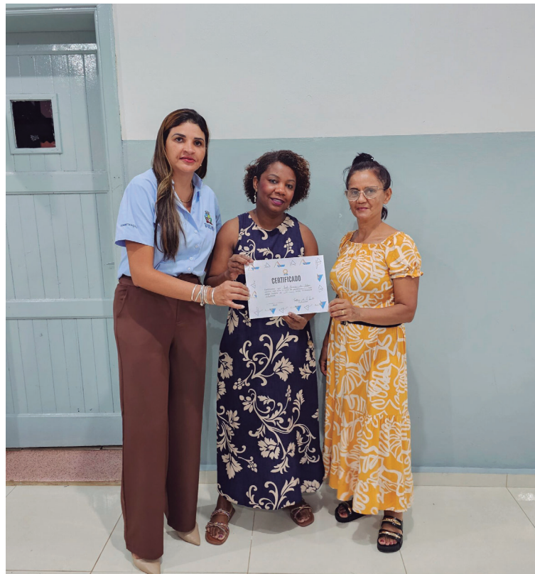
Participantes conquistaram conhecimentos fundamentais para o exercício da profissão