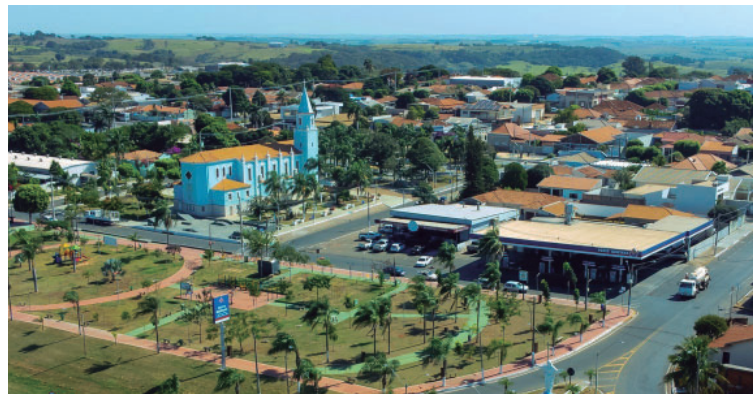
Município participou de reunião que teve como objetivo qualificar ações e serviços

A participação de Quintana no processo ocorre em um momento de revisão e organização das políticas públicas do setor, com foco no planejamento de médio e longo prazo. O Plano Municipal de Assistência Social estabelece metas, prioridades e estratégias que orientam a atuação do município e servem como instrumento para avaliação e controle social das ações