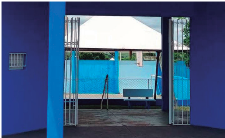
Centro Esportivo Ivan Giroto passou por reformas estruturais e adequações