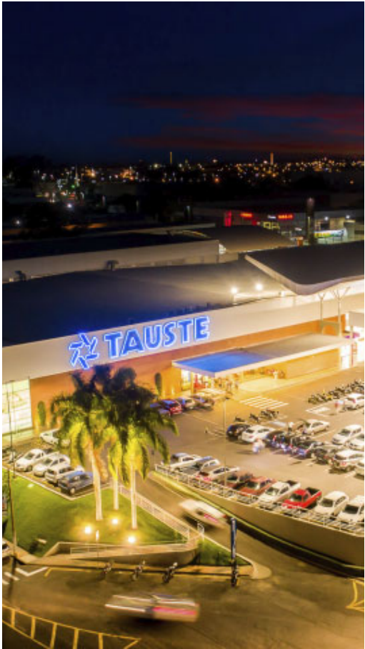
Foram mais de R$ 2 milhões em prêmios