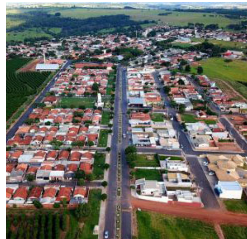
Município abriu período de inscrições