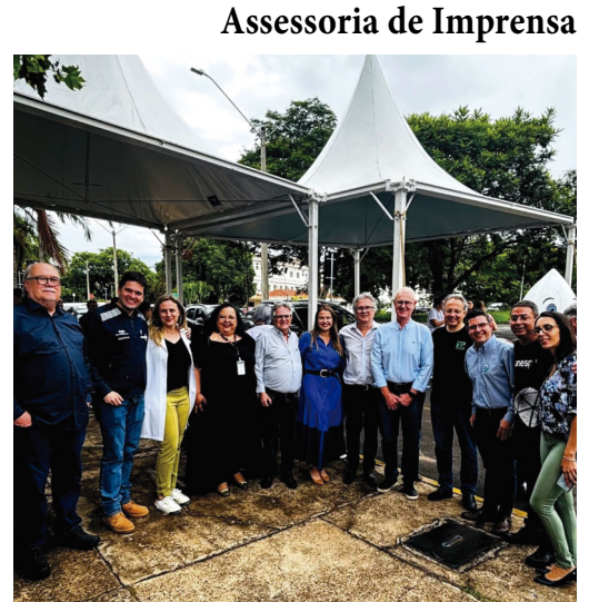
Assessoria de Imprensa

A mobilização envolveu 21 profissionais, entre agentes de controle de endemias, agentes comunitários de saúde e supervisores. As visitas ocorreram na USF Aeroporto (bairro Colibri), com 340 casas em 19 quadras; na UBS Nova Marília,