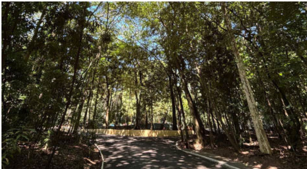
Serviço é gratuito e pode ser solicitado pelos munícipes por meio de WhatsApp

Com o slogan "Planejamento hoje, futuro verde amanhã", o projeto busca envolver a população no cuidado com os espaços urbanos, estimulando a participação dos moradores na construção de uma cidade mais sustentável e harmoniosa.