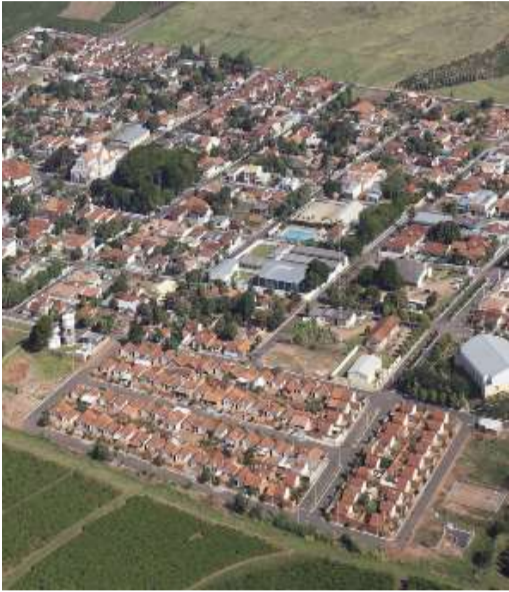
Município terá novo processo licitatório

A Prefeitura de Lupércio realizará no próximo dia 12 de fevereiro processo licitatório para o registro de preços visando futuras aquisições de combustíveis destinados ao abastecimento da frota municipal. O valor estimado do certame é de R$ 1.946.165,88, montante que representa uma previsão de consumo para 12 meses. De acordo com o edital, a licitação será realizada na modalidade pregão eletrônico, pelo sistema de registro de preços, com sessão pública marcada para 9h. O objetivo da contratação é garantir o fornecimento contínuo de combustíveis para veículos leves e pesados, ambulâncias, máquinas e tratores pertencentes à frota da Prefeitura, assegurando a regularidade dos serviços públicos prestados no município. Os combustíveis serão utilizados para atender as demandas de