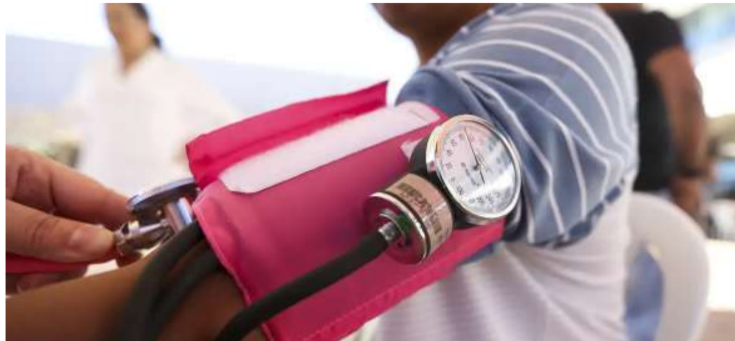
Aquisição tem como objetivo garantir a qualidade dos serviços prestados pela DMHS

Ao todo, estão previstos 261 itens, entre eles abaixadores de língua de madeira, adaptadores de agulha para coleta de sangue a vácuo, água oxigenada, aparelhos de pres-