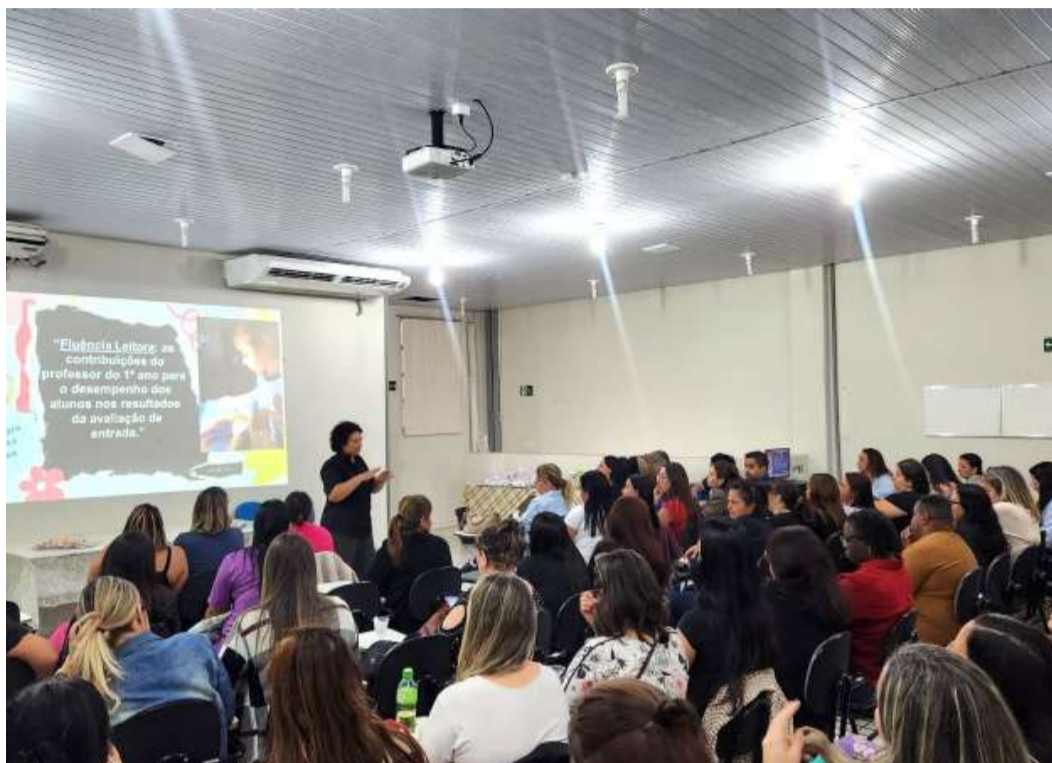
Reconhecimento nacional destaca eficácia de políticas educacionais e evolução em índices

A cerimônia de entrega do selo será realizada em Brasília, no mês de fevereiro. A classificação Ouro é destinada às redes que cumprem rigorosamente as condicionalidades e ações estruturantes voltadas à alfabetização. Em Marília, a meta estipulada era de 62% de alunos alfabetizados ao final do 2º ano. O município superou o índice e atingiu 81%, evidenciando a