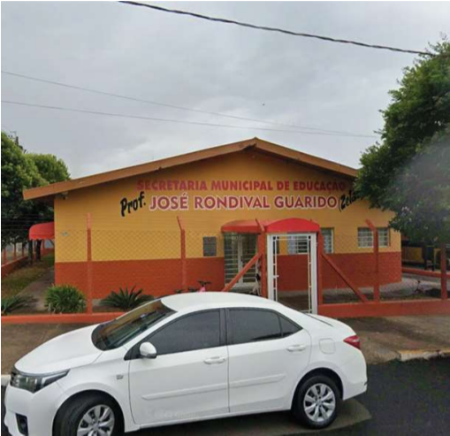
Município garantiu uniformes para 2026

tura promove, no próximo sábado (31), das 14h às 18h, uma ação com brinquedos, cachorro-quente e refrigerante, na Rodoviária Municipal. Todas as atividades são gratuitas.