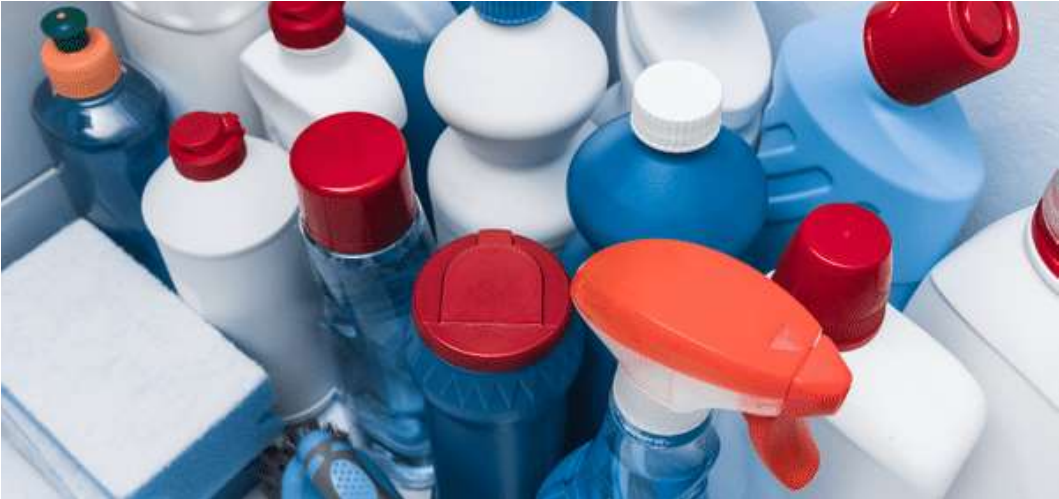
Prefeitura publicou registro de preços de itens de higiene, limpeza e descartáveis

De acordo com o Portal da Transparência, estão previstos 36 itens, incluindo produtos como água sanitária (em diferentes vo-