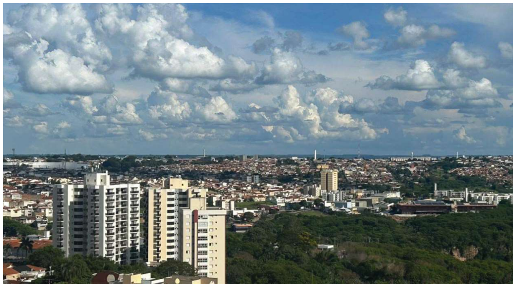
Estoque de mais de 71 mil empregos formais representa variação positiva de 1,64%

avanço moderado do mercado de trabalho local, em um cenário marcado por oscilações ao longo dos meses.