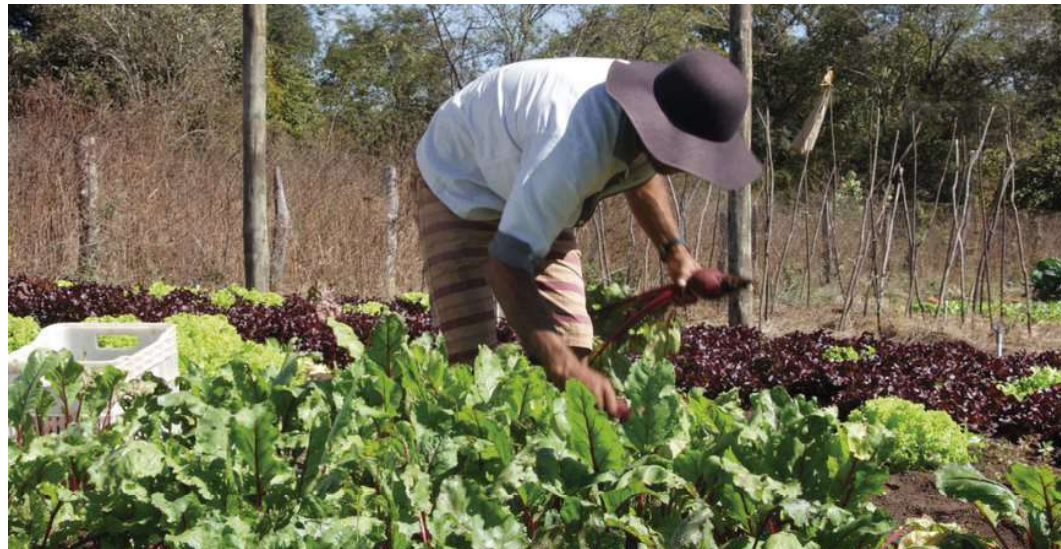
Seleção prioriza produtores de Ocauçu e região; medida fortalece economia local

As propostas devem ser enviadas até o dia 24 de fevereiro, às 10h, exclusivamente por meio do sistema eletrôni-