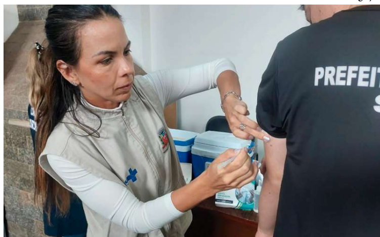
Grupo de Vigilância Epidemiológica de Marília recebeu mais de 2,6 mil doses