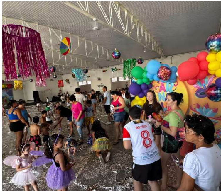
Registro da Matinê de Carnaval de 2025; neste ano, festa será no dia 15 de fevereiro