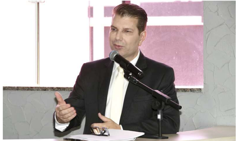
Reajuste foi viabilizado por meio de planejamento e medidas de controle orçamentário

a concessão do reajuste no início do ano busca garantir previsibilidade administrativa e manter o equilíbrio entre responsabilidade fiscal e