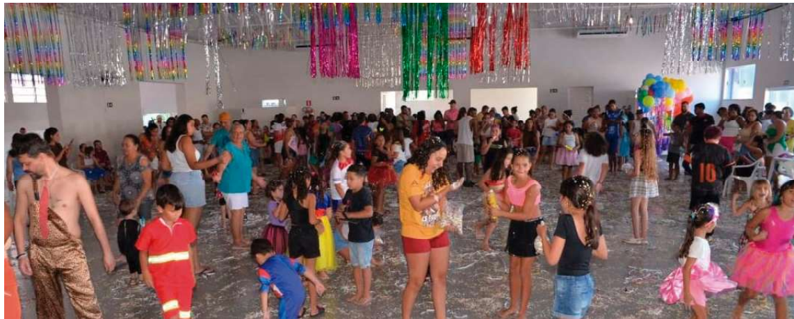
Além da programação festiva, houve distribuição gratuita de sorvetes e pipoca aos participantes do grande evento

Além da programação festiva, houve distribuição gratuita de sorvetes e pipoca aos parti-