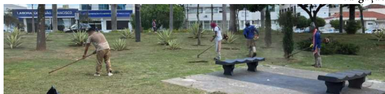
Equipes trabalham nos bairros da zona Oeste da cidade durante esta semana