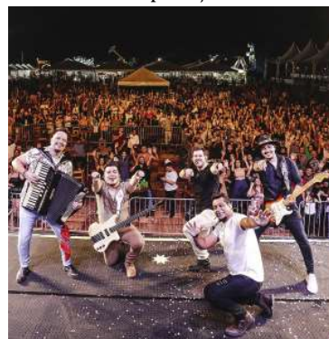
Grupo Tradição é atração confirmada