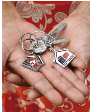
Novo convênio garante mais moradias

Quintana e Timburi. As unidades serão viabilizadas por meio da produção direta da CDHU ou da modalidade Carta de Crédito Associativa.