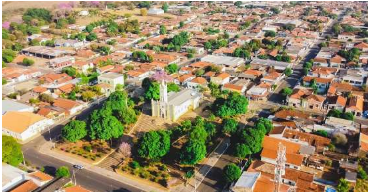
Editais publicados pela Prefeitura contam com recursos do governo estadual

a partir do dia 9 de fevereiro, com encerramento no dia 3 de março, quando também ocorrerá a abertura da disputa eletrônica