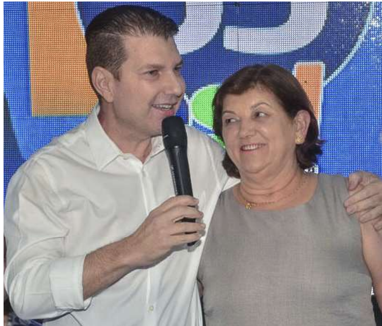
Anúncio foi feito pelo prefeito de Quintana, Fernando Itapuã, e a vice Clarice Porto

Ainda conforme a atual gestão, o adiantamento do 13º salário foi viabilizado a partir de planejamento financeiro e organização do orçamento municipal, respeitando critérios de controle de gastos e responsabilidade fiscal.