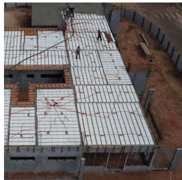
Obras continuam em ritmo acelerado

PREFEITURA MUNICIPAL DE POMPEIA www.pompeia.sp.gov.br – pmp@pompeia.sp.gov.br Rua Dr. José de Moura Resende 572 – Caixa Postal n.º 1 – CEP 17580-000 – Fone/Fax (14) 34051500