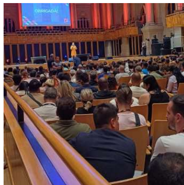
Evento foi realizado na capital paulista

acesso da população à cultura e ao fortalecimento da programação cultural nos municípios paulistas.