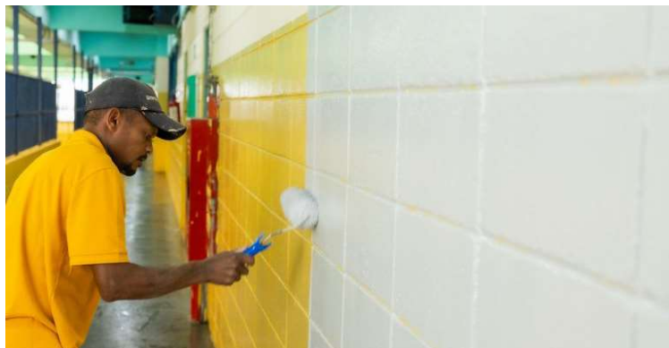
Foram entregues 112 obras em escolas e creches na região durante o ano passado

Seduc-SP (Secretaria da Educação do Estado de São Paulo) revitalizou 115 prédios escolares em 46 municípios da região, por meio da FDE (Fundação para o Desenvolvimento da Educação) e de convênios firmados com prefeituras.