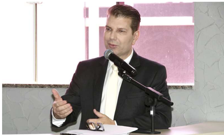
Reajuste foi viabilizado por meio de planejamento e medidas de controle orçamentário

a concessão do reajuste no início do ano busca garantir previsibilidade administrativa e manter o equilíbrio entre responsabilidade fiscal e