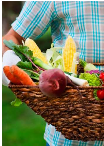
Município iniciou a execução do PAA

e da mulher no campo, estimular a diversificação da produção e fortalecer a economia