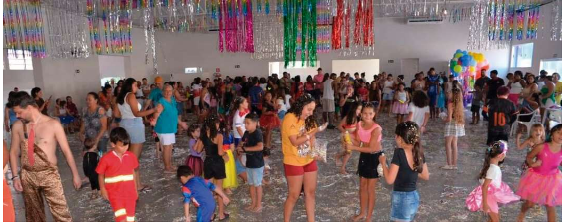
Além da programação festiva, houve distribuição gratuita de sorvetes e pipoca aos participantes do grande evento

Além da programação festiva, houve distribuição gratuita de sorvetes e pipoca aos parti-