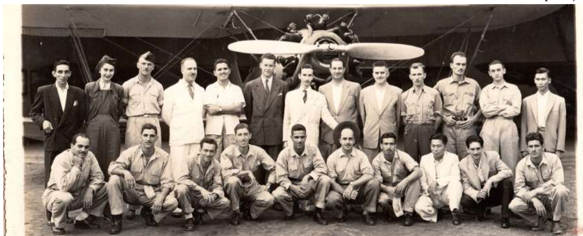
Ao longo de mais de oito décadas, a entidade contribuiu para a formação de pilotos e a difusão da cultura aeronáutica na região

Segundo informações históricas divulgadas em seu site oficial, foi em Marília que nasceu a companhia aérea TAM (Transportes Aéreos Marília), que posteriormente se tornaria uma das maiores empresas do setor no país. A escola de