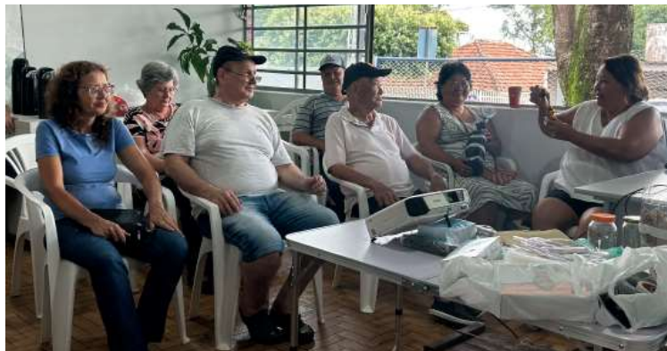
Curso contou com atividades que ensinaram os alunos a aplicar diferentes técnicas

Durante as aulas, os participantes receberam orientações sobre identificação de espécies — mais de 300 já catalogadas no Brasil —, técnicas de manejo, cuidados ambientais e a impor-