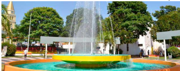
Praça Jesus Maria terá investimento de mais de R$ 885 mil para revitalização

O primeiro edital, de nº 02/2026, trata da reforma da Praça Jesus Maria, com valor estimado em R$ 885.483,40. A obra será realizada com recursos do Convênio nº 091150, firmado entre o município e o Governo do Estado de São Paulo, com contrapartida municipal. A sessão de disputa de preços está marcada para o dia 6