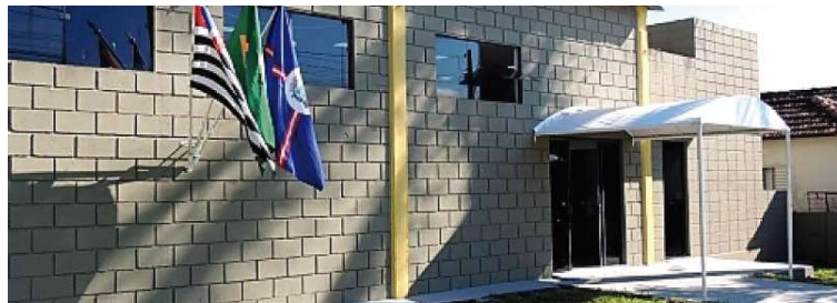
Prazo para adesão ao programa municipal segue vigente até o dia 30 de setembro