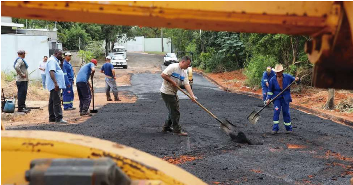
Serviços de pavimentação, tapa-buracos, construção de guias, sarjetas e galerias de escoamento de água deixam de ser atribuição da Codemar