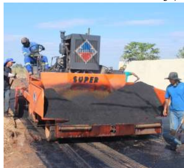
Serviços serão realizados pela Prefeitura

e mantêm salários e benefícios já previstos em acordo coletivo, como anuênio, vale-alimentação e cesta básica.