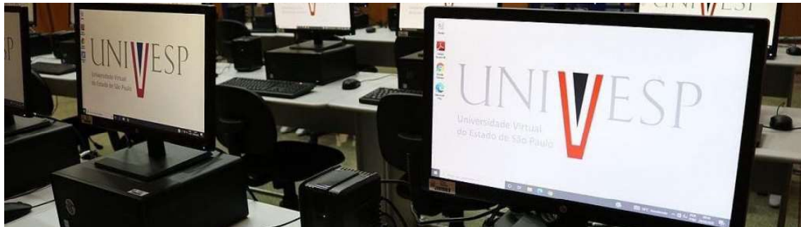
Universidade Virtual do Estado de São Paulo oferece vagas para cursos gratuitos; inscrições devem ser realizadas até 11 de março