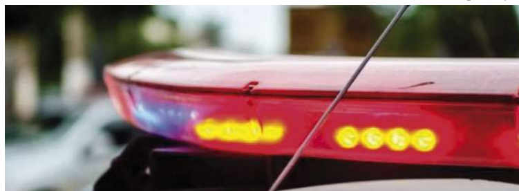
Caso foi registrado como homicídio e será investigado pela Polícia Civil de Marília