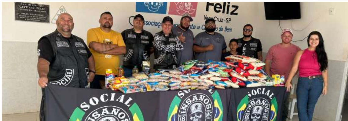
Ação foi organizada pelo Insanos MC – Regional Marília/SP e Clube do Ômega – Marília/SP, com apoio da Prefeitura e Câmara