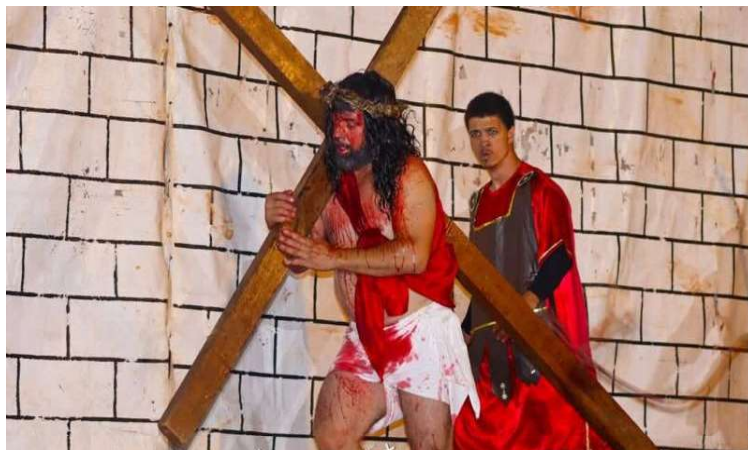
30ª Encenação da Paixão de Cristo está marcada para a Sexta-Feira Santa, dia 3 de abril

Os preparativos para a edição comemorativa foram discutidos em reunião realizada no Paço Municipal, que definiu ajustes organizacionais e a logística necessária para a realização do evento. A encenação é promovida pela Pa-