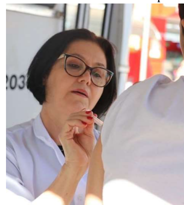
Ações ocorrem em diferentes pontos