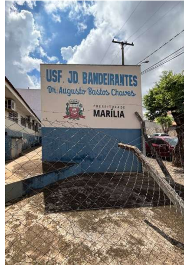
Esta é a 20ª intervenção na área da saúde

era uma demanda antiga. De acordo com ela, a intervenção deve proporcionar melhores