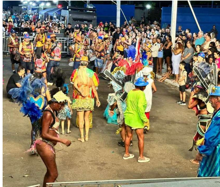
Registro da edição de 2025 do carnaval na cidade; programação deste ano é definida

Além das atrações musicais, o evento contará com praça de alimentação montada no local, oferecendo opções gastronômicas ao público. A estrutura foi preparada para receber moradores e visitantes durante os três dias de programação.