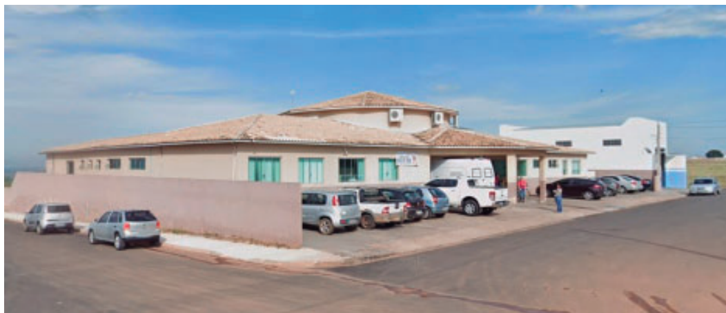
Compra é considerada essencial para garantir o atendimento adequado da população

A disputa será realizada no dia 24 de abril, em formato de pregão eletrônico, com recebimento de propostas até as 9h e início da sessão de lances às 9h30, por meio da plataforma da BLL (Bolsa de Licitações e Leilões). O critério de julgamento será o menor preço por item.