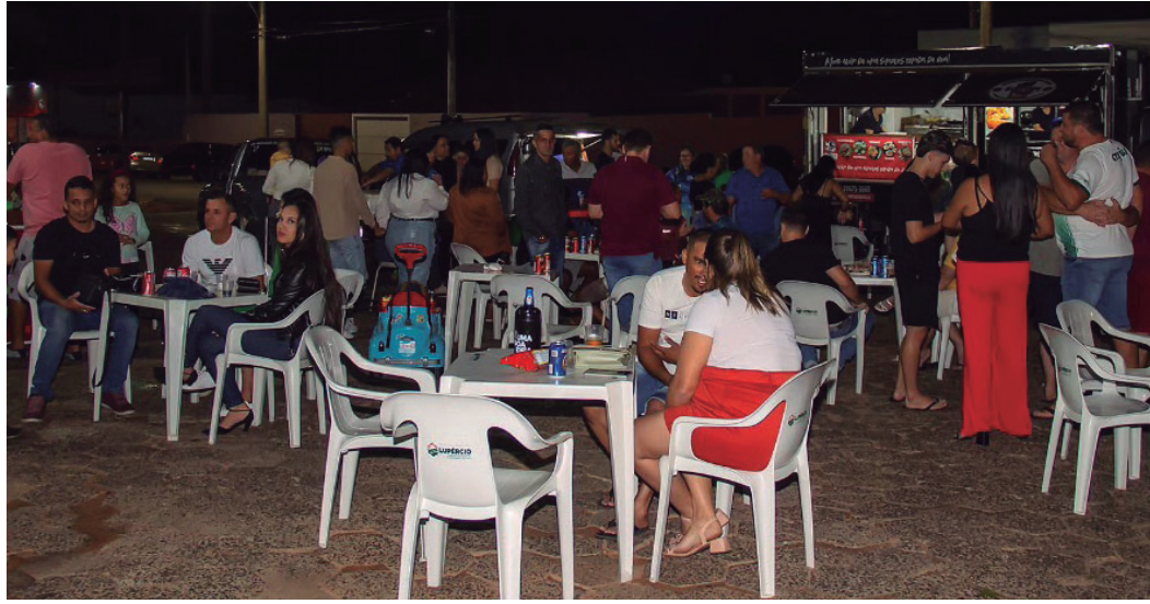
Registro de edição anterior da Feira do Empreendedor; próximo evento será no dia 11