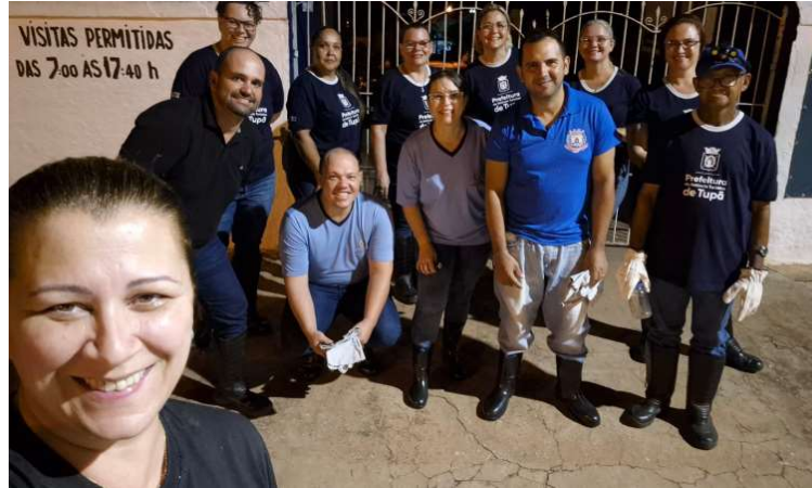
Capacitação realizada em Tupã reuniu agentes de combate a endemias de Herculândia

Durante o treinamento, foram abordados conteúdos relacionados às técnicas corretas de captura, identificação das espécies de escorpiões, uso adequado de EPIs (Equipamentos de Proteção Individual) e procedi-