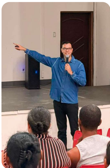
Palestra esclareceu dúvidas sobre programas sociais