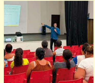
Palestra abordou regras de programas