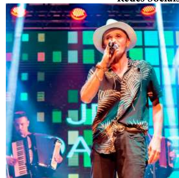
JB Banda Show se apresenta neste sábado