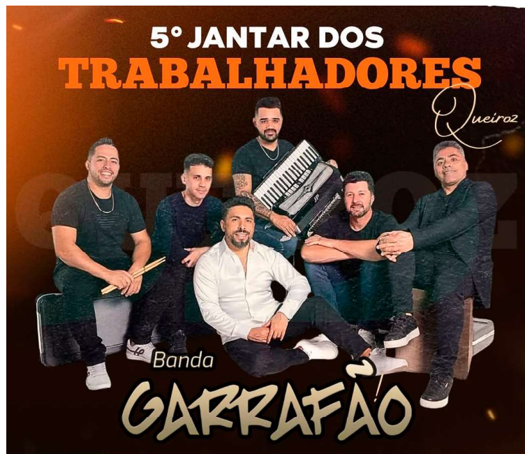
Além do jantar, os participantes contarão com atrações musicais ao longo da noite

Valor da publicação: R$ 28,00. Conforme Lei Municipal nº 2.650, de 30 de março de 2016