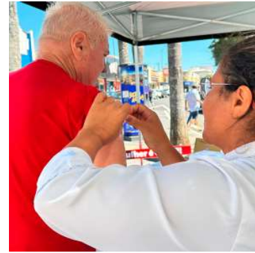
Grupos prioritários são foco da ação