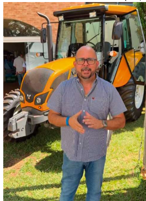
Município sanciona duas leis: uma veta condenados por violência doméstica em cargos públicos e outra cria programa escolar do agro