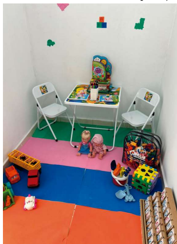
Educação de Queiroz forneceu materiais