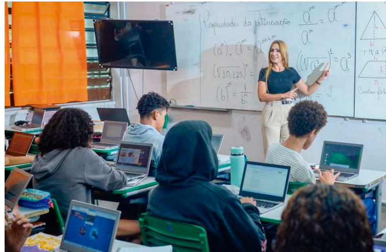
Crescimento no valor da bonificação está relacionado aos indicadores educacionais