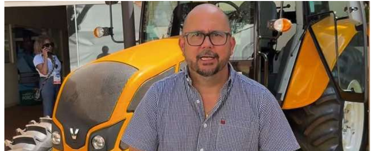
Prefeito informou que o convênio firmado garante a destinação de um novo trator