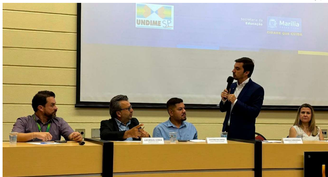
Evento sediado em Marília reuniu representantes da área da Educação de 54 municípios para discutir políticas públicas