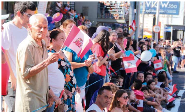
Registro de comemoração de ano anterior na cidade; agenda segue durante o mês

Às 8h, será realizado o hasteamento das bandeiras em frente à Prefeitura. Em seguida, a par-