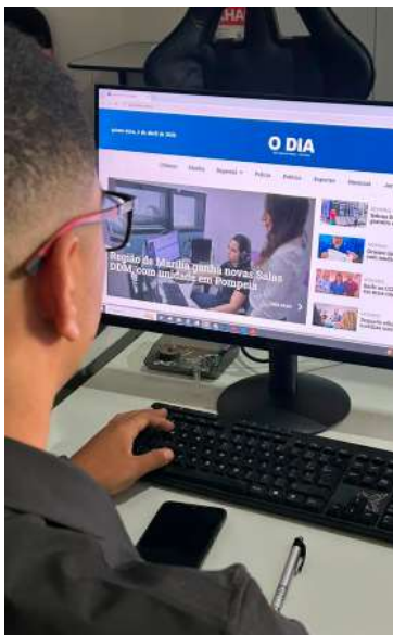
Jornal cresceu quase 400% no digital

visualizações em 2025, com alcance superior a 34 mil contas — aumento de 42% — além de 3,3 mil interações, crescimento de 100%, também de forma orgânica. Já no Facebook, foram mais de 56 mil visualizações e cerca