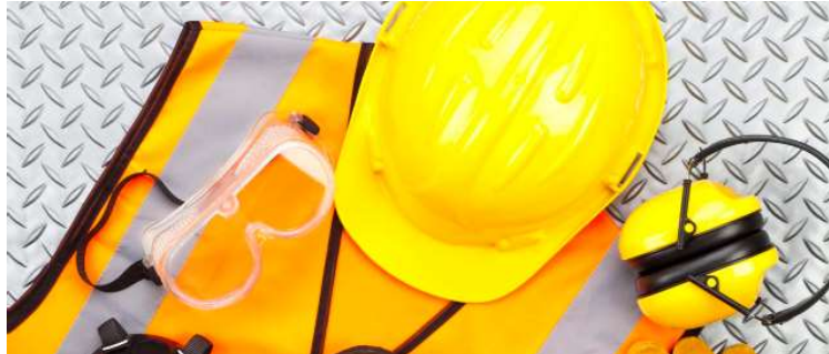
Equipamentos de Proteção Individual serão destinados a Obras e Infraestrutura Urbana

A contratação tem como objetivo a reposição e complementação do estoque de EPIs, com a finalidade de garantir condições