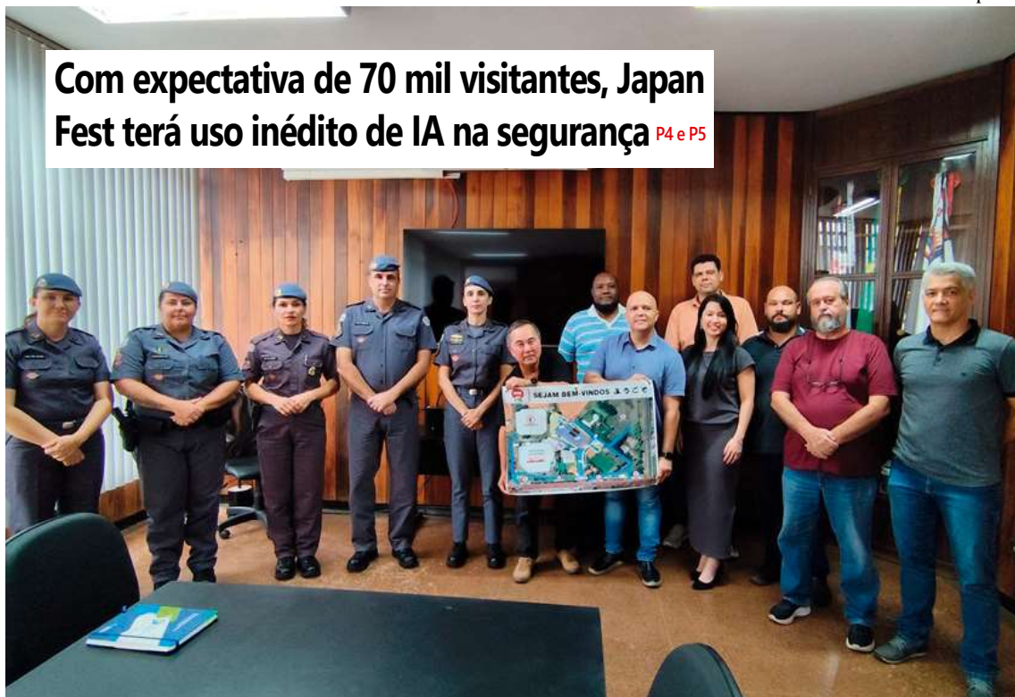
Projeto piloto com reconhecimento facial será testado durante os cinco dias de evento na zona Norte de Marília

Com expectativa de 70 mil visitantes, Japan Fest terá uso inédito de IA na segurança P4 e P5