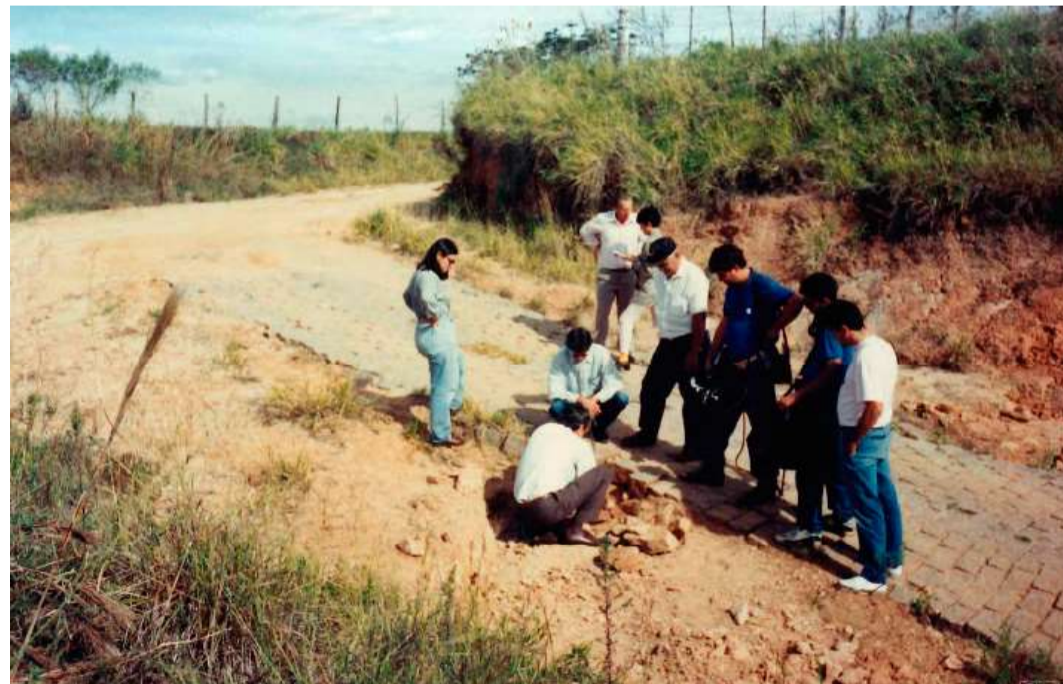
Trajétória iniciada há 33 anos consolidou Marília como ‘Terra de Dinossauros’