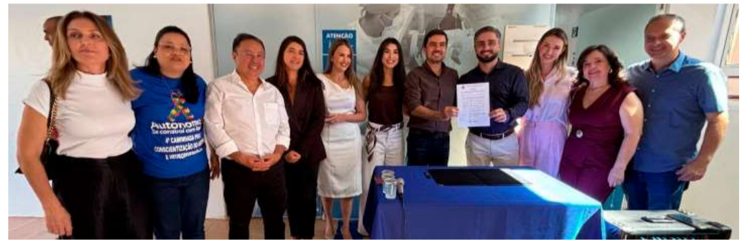
Formalização do convênio ocorreu na Unimar e contou com a presença de autoridades