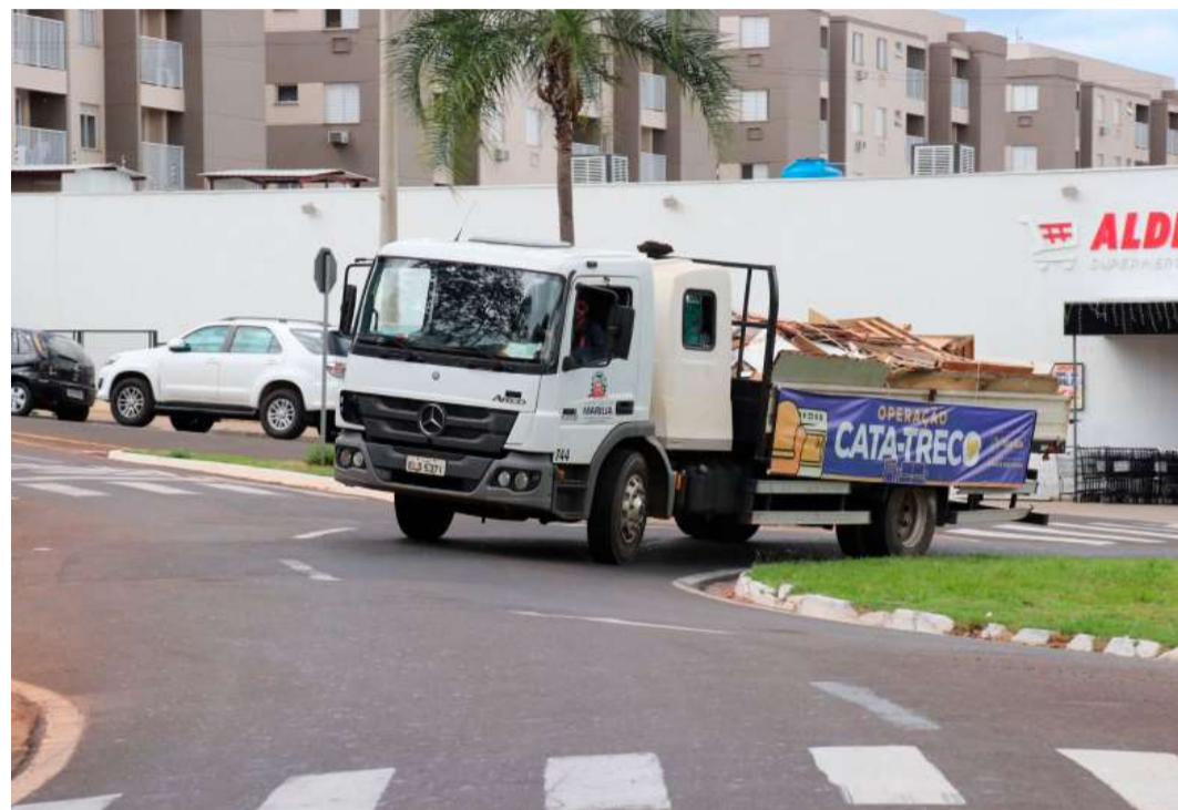
Iniciativa da Prefeitura de Marília facilita o descarte correto de materiais inservíveis

Valor da publicação: R$ 28,00. Conforme Lei Municipal Nº 2.650, de 30 de março de 2016