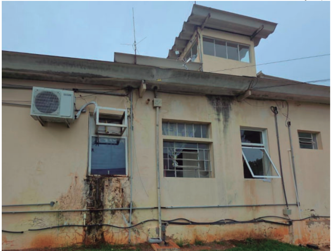
Vistoria identifica fissuras, risco estrutural e recomenda interdição do terminal do Aeroporto de Marília por questões de segurança