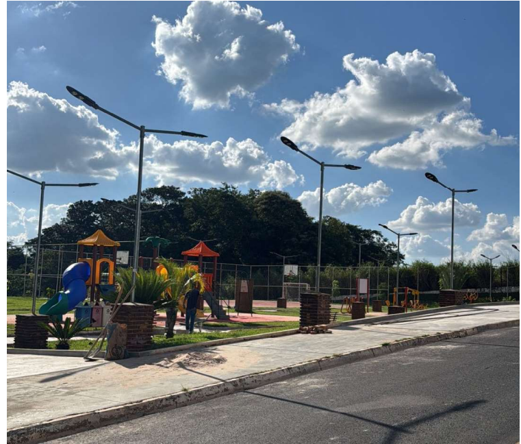
Intervenções integram série de melhorias contínuas promovidas no município

De acordo com a administração municipal, as intervenções integram um conjunto de melhorias contínuas na cidade, com foco na manutenção de espaços públicos e na qualidade dos serviços oferecidos à população.