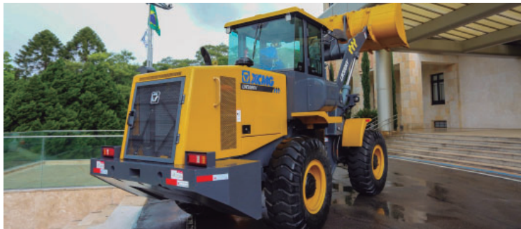
Maquinário agrícola será destinado a municípios de toda a região de Marília

Ao todo, serão entregues 11 equipamentos a dez cidades: Alvinlândia, Arco-íris, Bernardino de Campos, Florínea, Lutécia, Ocaçu, Ourinhos, Paraguaçu Paulista, Queiroz e Salto Grande. Os maquinários incluem tratores, retroscavadeiras, motoniveladoras, pás-carregadeiras e triturador de galhos, com o objetivo de re-