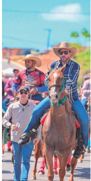
Evento integra calendário comemorativo

Valor da publicação: R$ 9,86. Conforme Lei Municipal Nº 2.650, de 30 de março de 2016