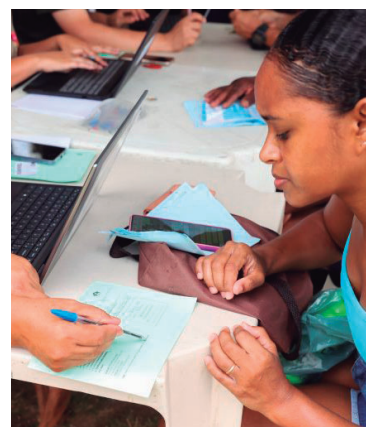
Desconto chega a 71 mil pessoas na região

Valor da publicação: R$ 56,00. Conforme Lei Municipal Nº 2.650, de 30 de março de 2016