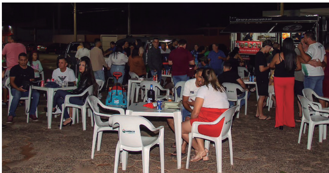
Registro de edição anterior da Feira do Empreendedor; próximo evento será no dia 11