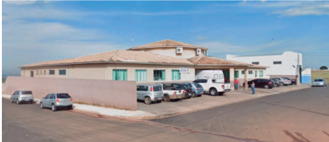
Compra é considerada essencial para garantir o atendimento adequado da população

A disputa será realizada no dia 24 de abril, em formato de pregão eletrônico, com recebimento de propostas até as 9h e início da sessão de lances às 9h30, por meio da plataforma da BLL (Bolsa de Licitações e Leilões). O critério de julgamento será o menor preço por item.