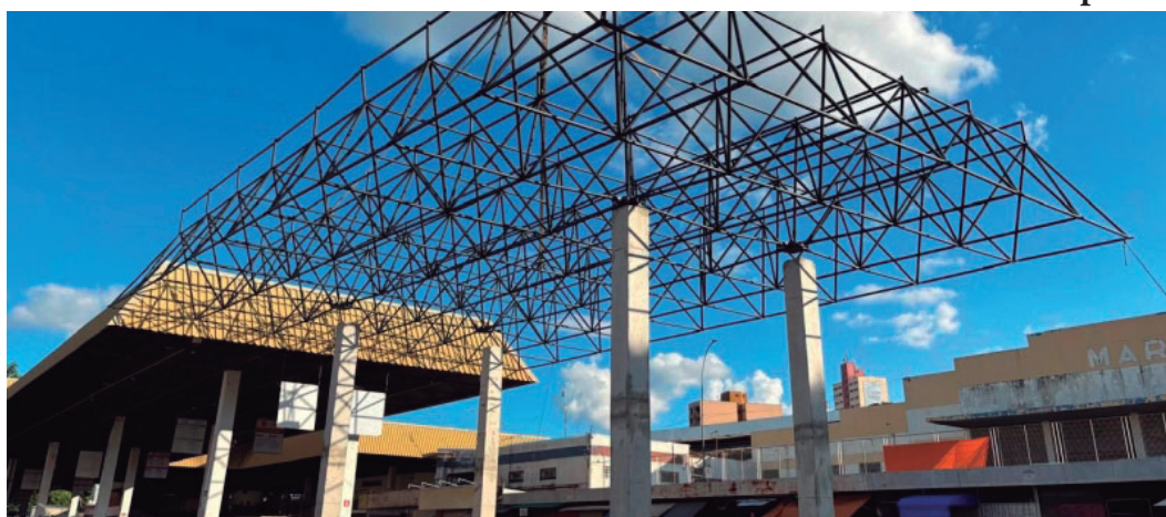
Local passou por uma série de intervenções estruturais; entrega oficial será no dia 9