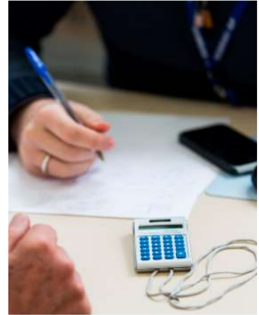
Evento será realizado no dia 13 de abril

Valor da publicação: R$ 8,12. Conforme Lei Municipal nº 2.650, de 30 de março de 2016