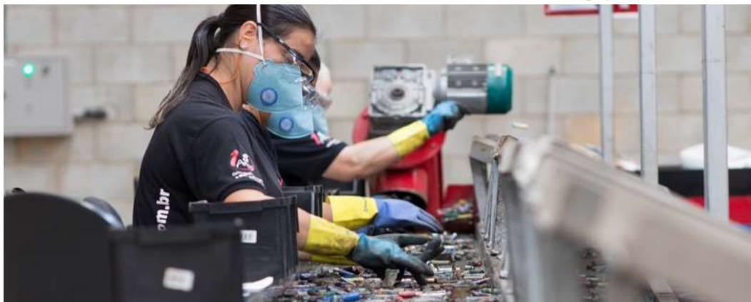
Pilhas e baterias são encaminhadas para reciclagem no sistema de logística reversa

de pilhas e baterias tiveram destinação correta apenas em 2025. O avanço acompanha uma tendência nacional: nos últimos cinco anos, o Brasil ampliou em 62% o número de pontos de coleta, somando atualmente mais de 11 mil unidades em funcionamento, segundo dados da Green Eletron, entidade gestora de logística reversa no setor.