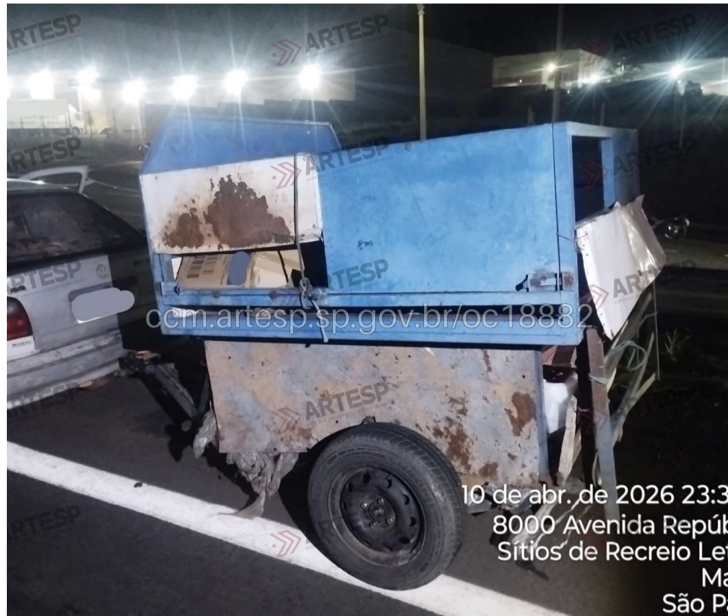
Motocicleta teria colidido contra uma carretinha-reboque acoplada a um veículo

A perícia técnica foi acionada e deverá apontar as causas exatas da ocorrência. O caso será investigado pela Polícia Civil.