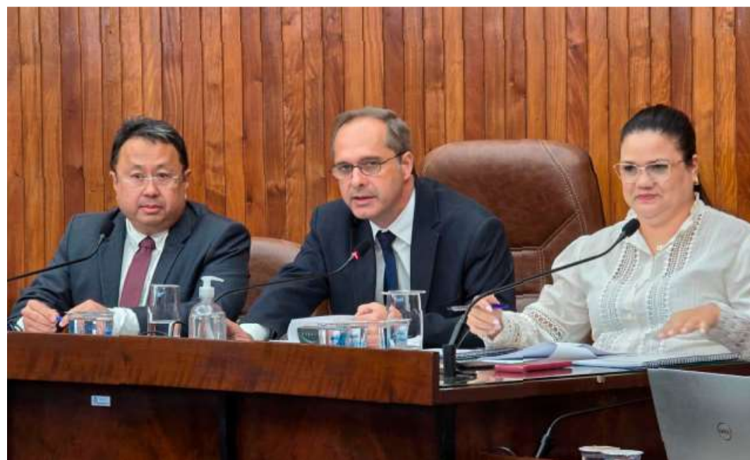
Mesa Diretora da Câmara; sessão ordinária ocorre no próximo dia 13, a partir das 16h