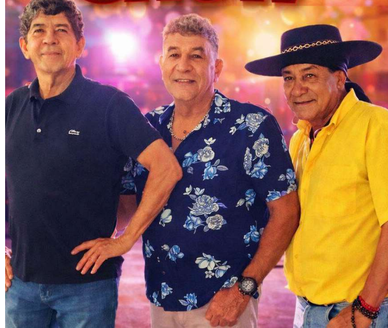
Banda Bailança Show promete repertório de forró, piseiro e ritmos dançantes

Valor da publicação: R$ 8,12. Conforme Lei Municipal N° 2.650, de 30 de março de 2016