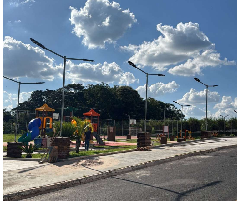
Intervenções integram série de melhorias contínuas promovidas no município

De acordo com a administração municipal, as intervenções integram um conjunto de melhorias contínuas na cidade, com foco na manutenção de espaços públicos e na qualidade dos serviços oferecidos à população.