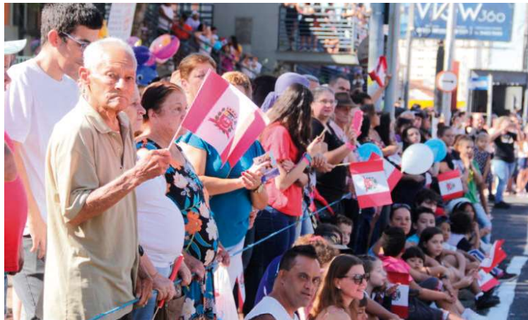
Registro de comemoração de ano anterior na cidade; agenda segue durante o mês

Às 8h, será realizado o hasteamento das bandeiras em frente à Prefeitura. Em seguida, a par-