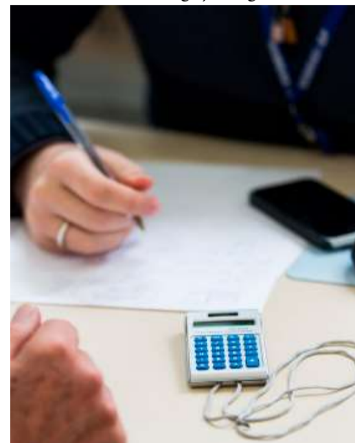
Evento será realizado no dia 13 de abril

Valor da publicação: R$ 8,12. Conforme Lei Municipal Nº 2.650, de 30 de março de 2016