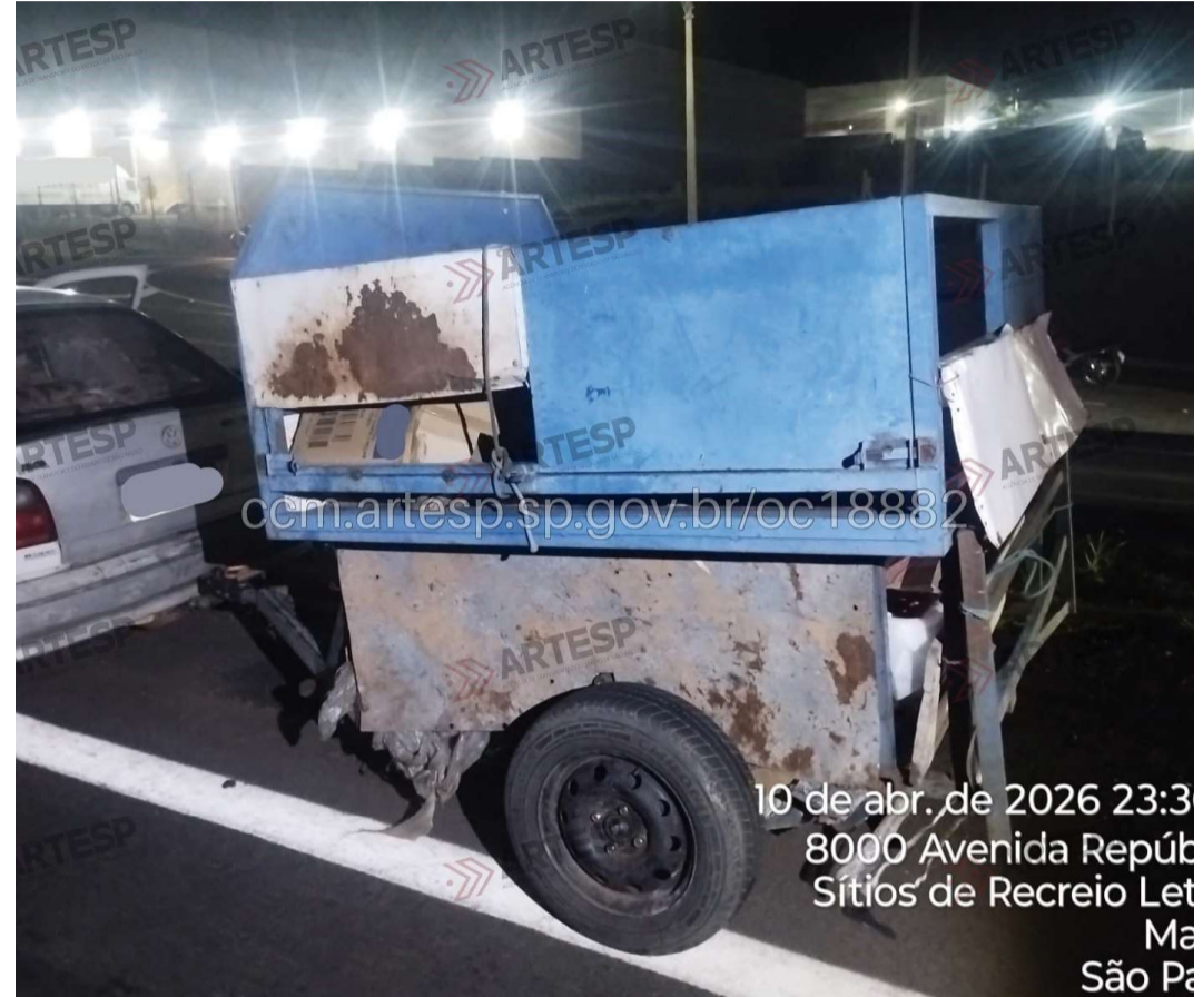
Motocicleta teria colidido contra uma carretinha-reboque acoplada a um veículo

A perícia técnica foi acionada e deverá apontar as causas exatas da ocorrência. O caso será investigado pela Polícia Civil.