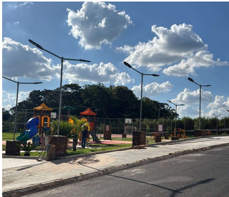
Intervenções integram série de melhorias contínuas promovidas no município

De acordo com a administração municipal, as intervenções integram um conjunto de melhorias contínuas na cidade, com foco na manutenção de espaços públicos e na qualidade dos serviços oferecidos à população.