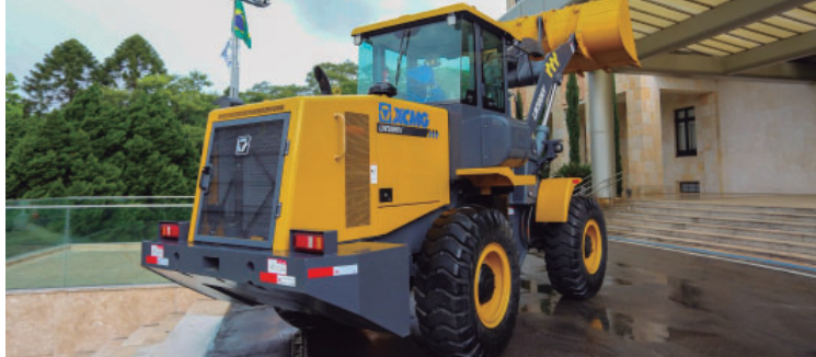
Maquinário agrícola será destinado a municípios de toda a região de Marília

Ao todo, serão entregues 11 equipamentos a dez cidades: Alvinlândia, Arco-íris, Bernardino de Campos, Florínea, Lutécia, Ocaçu, Ourinhos, Paraguaçu Paulista, Queiroz e Salto Grande. Os maquinários incluem tratores, retroscavadeiras, motoniveladoras, pás-carregadeiras e triturador de galhos, com o objetivo de re-