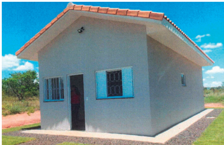
Obras devem ter início em Oscar Bressane; previsão de conclusão é de 15 meses

RA Marília, contratado para conduzir as intervenções de engenharia necessárias à implantação das moradias. A previsão de conclusão é de aproximadamente 15 meses.