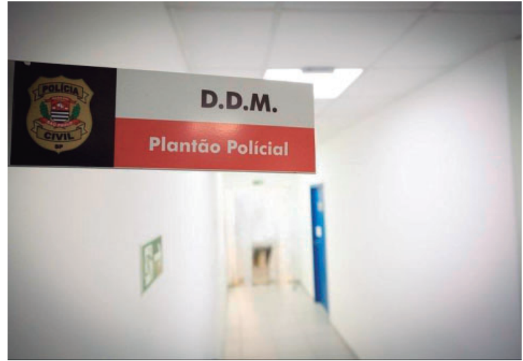
Caso foi registrado como tentativa de feminicídio e descumprimento de medida protetiva