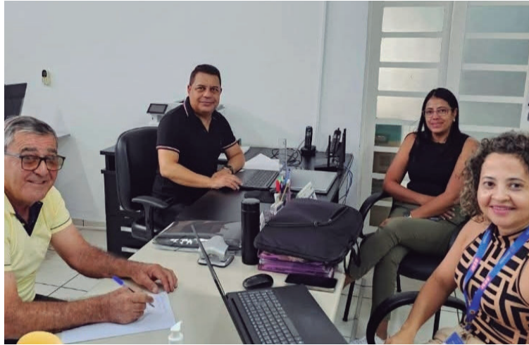
Ação reuniu representantes de todas as secretarias para atender a população