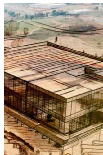
Marília prepara área para AME com atendimento para a região