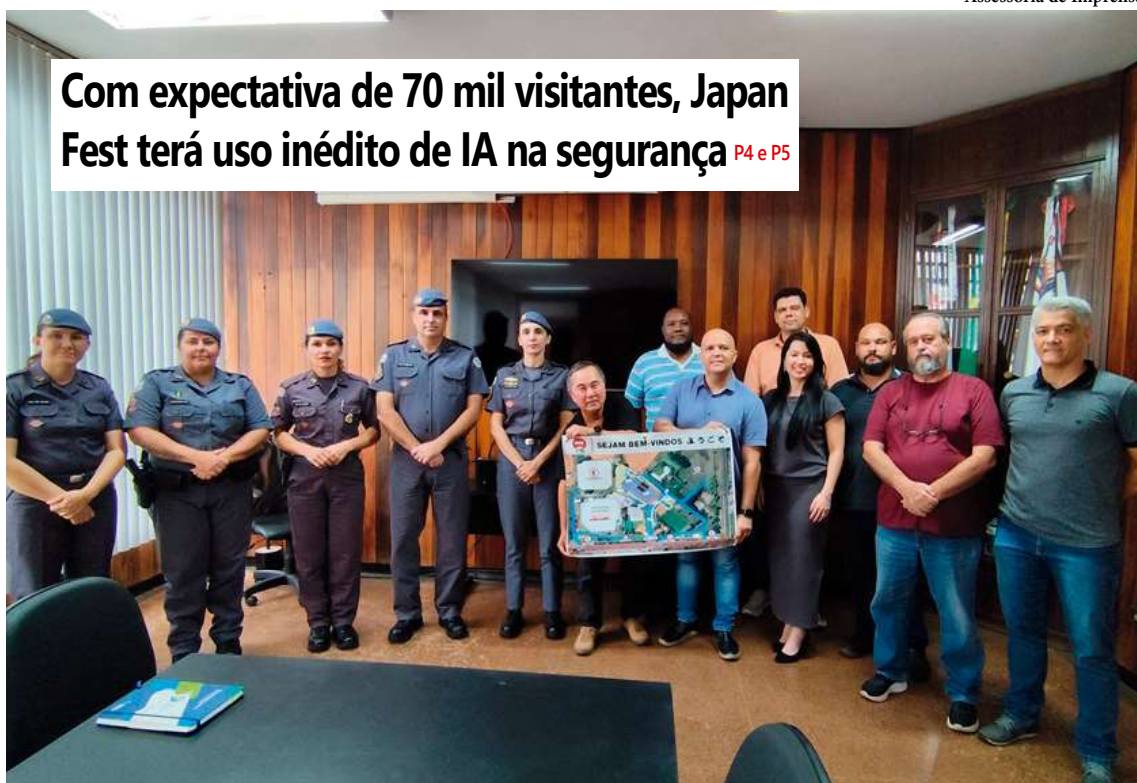
Projeto piloto com reconhecimento facial será testado durante os cinco dias de evento na zona Norte de Marília

Com expectativa de 70 mil visitantes, Japan Fest terá uso inédito de IA na segurança P4 e P5